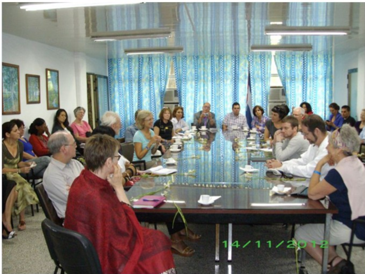
Fig. 5. Imagen del encuentro con importantes editores de revistas internacionales.