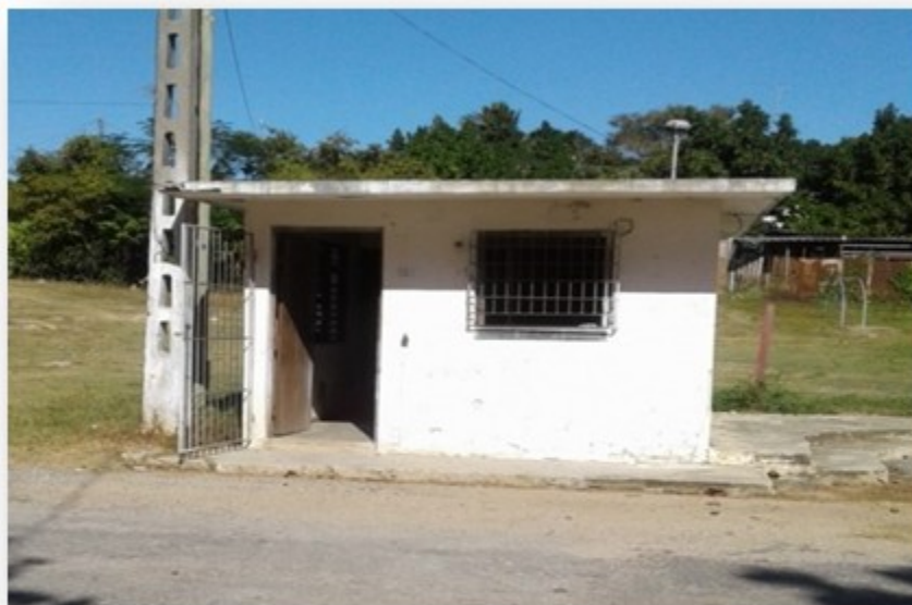
Fig. 2. Local que hoy ocupa el tele correo, que se encuentra en la ubicación donde estaba la zapatería.