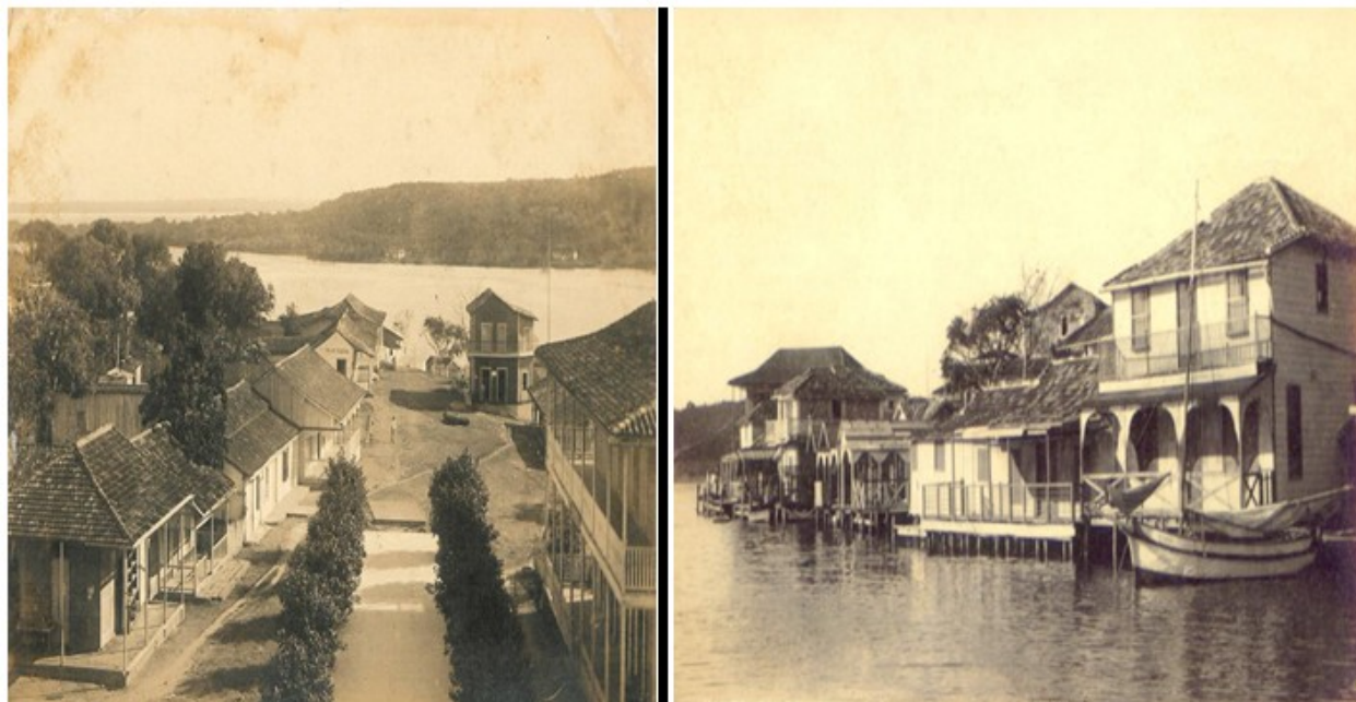
Fig. 1. Imágenes del poblado donde nació Perico.

Rodeado por un marco histórico-social de pobreza, padeció desde muy joven las deficiencias de su entorno social, supo de los daños de los poderosos, conoció la pobreza y desigualdades de la época, fue el quinto de cinco hermanos, y a pesar de su corta edad se convierte en uno de los sostenes de la familia.