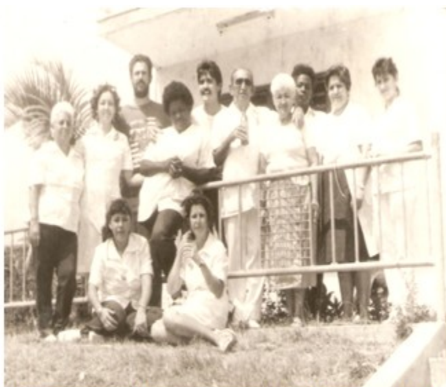
Acto por la entrega de la medalla Manuel “Piti” Fajardo