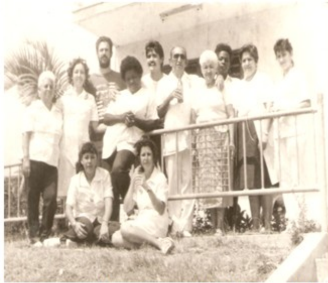
Acto por la entrega de la medalla Manuel "Piti" Fajardo