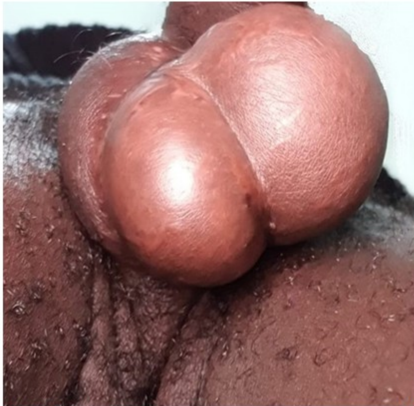
Fig. 4. Paciente que ingresó por presentar gangrena de Fournier (el mismo de la figura 1) después de 35 días de internamiento, cierre de bolsa escrotal por tercera intención. Obsérvese pérdida de pliegues en la piel del escroto.

reconstrucción ideal pero solo es posible en lesiones de tamaño medio. (9) (Fig. 4).