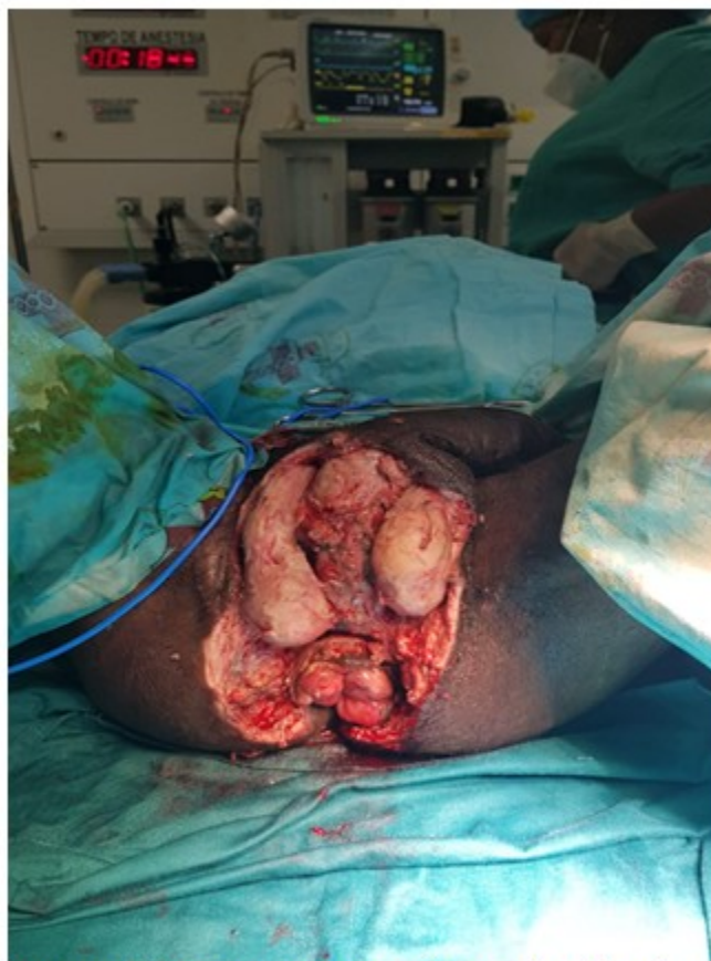
Fig. 3. Paciente con gangrena de Fournier (el mismo de la figura 2) después de su tercera visita al salón de operaciones, prácticamente sin esfacelos ni focos de necrosis.

Se sugiere una media de 3,5 operaciones por paciente para un adecuado control de la infección. (9) Los tejidos son cultivados de modo rutinario y se obtienen biopsias que aseguran la resolución de la infección para la ulterior reconstrucción e injerto, práctica que mejora los resultados en los cuidados. (15)