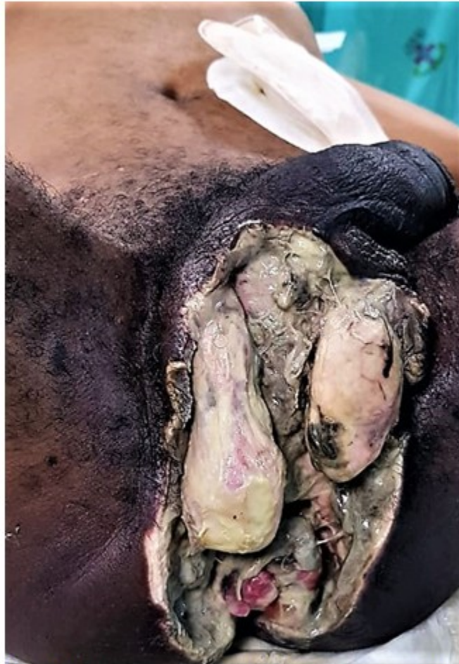
Fig. 2. Paciente con gangrena de Fournier a punto de partida de absceso perianal y extensión a escroto. Presenta áreas de tejido necrótico y abundante esfacelo. Obsérvese la colostomía sigmoidea.

ocasión al salón de operaciones para retirar tejido considerado no viable. El desbridamiento inicial con margen de tejido sano, observación frecuente de la herida y desbridamiento repetido son medidas necesarias para controlar la infección. (Fig. 2 y Fig. 3).