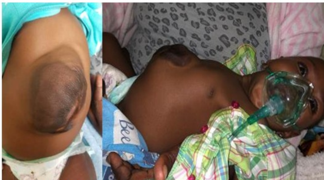
Fig. 1 y 2 Vista anterior y lateral de la ectopia cordis.

muscular. Aparato Respiratorio: Frecuencia respiratoria: 56'. Polipnea, Tiraje intercostal y subcostal. Murmullo vesicular rudo. Se auscultan ruidos transmitidos. Frecuencia cardíaca: 158'. Ruidos cardíacos taquicárdicos que se auscultan en el abdomen. En este órgano se observa defecto de la pared abdominal en epigastrio que late (ectopia cordis). Se ingresa en el Servicio de Neonatología con oxigenoterapia, tratamiento antibiótico endovenoso con ampicilina y gentamicina. Se mantiene la monitorización de los signos vitales, fundamentalmente la glicemia. A los 7 días de nacida se coordina con el Hospital Princess Marina Hospital en Gaborone, la capital del país, para su remisión y evaluación por el Especialista de Cardiología Pediátrica para su estudio y posible tratamiento.