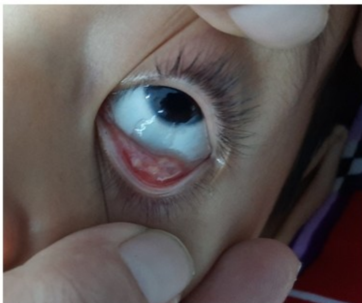
Fig. 1- Granuloma en conjuntiva tarsal del ojo izquierdo.

Al quinto día de su estancia, se apreció mejoría ligera desde el punto de vista clínico, pero se detectó tumoración blanquecina en conjuntiva tarsal de ojo izquierdo (diámetro 1x1cm), identificada por el oftalmólogo como granuloma. (Fig. 1).