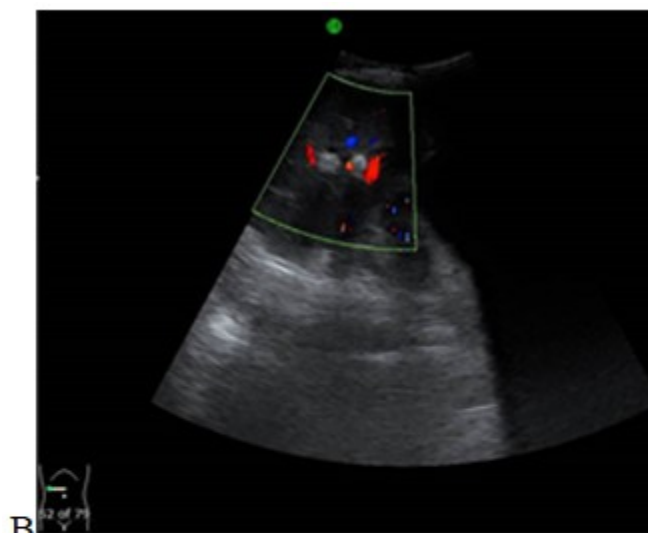
Fig. 1: Ecografía de abdomen (vista longitudinal a nivel del colédoco) que muestra un cálculo alargado dentro del colédoco dilatado y con flujo en la vena porta después de la aplicación del Doppler A.