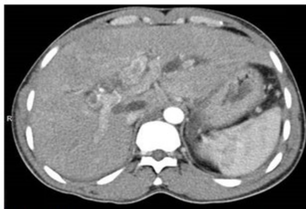
Fig. 4: Tomografía axial y con contraste en la fase arterial, muestra hiperdensidad (densidad de calcio) en la vía biliar dilatada por presencia de litiasis en las vías biliares.