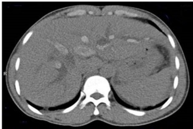
Fig. 3: Tomografía axial computarizada de abdomen, vista axial a nivel hepático sin contraste

los cuales lucían dilatados. En la figura 4 se comprobó: páncreas de tamaño normal, con mínima cantidad de líquido y edema peri pancreático, confirmando el diagnóstico de colecistitis litiásica y pancreatitis aguda secundaria, dilatación y litiasis de vías biliares intra y extrahepáticas.