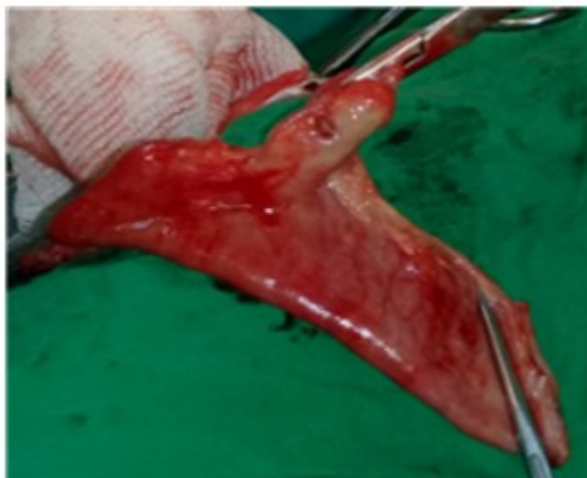
Fig 3. Pieza quirúrgica