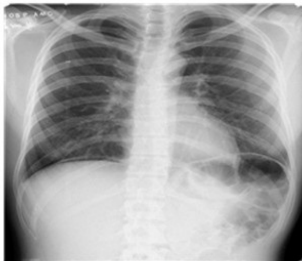
Figura 1. Rayos x de tórax (neumoperitoneo)