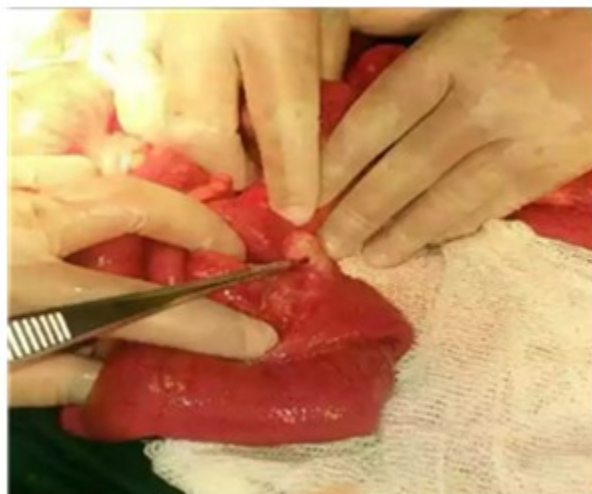
Fig.2 Hallazgo operatorio in situ

duodeno sin encontrar indicio de perforación. Se revisa el resto de la cavidad encontrando a 60 cm de la válvula ilio-cecal divertículo de Meckel perforado. (Fig 2).