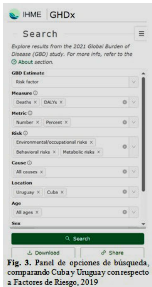
Fig. 3. Panel de opciones de búsqueda, comparando Cuba y Uruguay con respecto a Factores de Riesgo, 2019