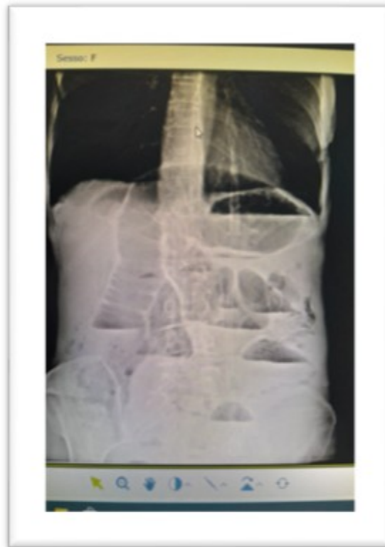
Fig. 1. Radiografía de abdomen simple postero-anterior, se muestran niveles hidroaéreos, dilatación de asas delgadas.

Se realizó tomografía axial computarizada que mostró las asas del íleon de aspecto convaleciente, llenos de material líquido. En el área ilíaca común izquierda, formación ovular hipodensa con densidad de líquido superfluido de aproximadamente 2 cm. Colon dólico con curso