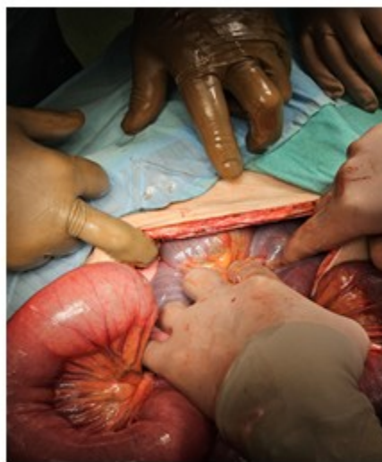
Imágenes Nro.7, 8. Muestran marcada dilatacion de asas delgada (íleon), cambio de coloracion, fuerte brida que provoca la torsión.