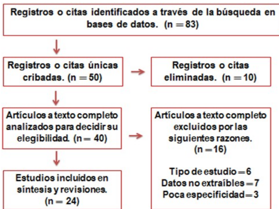
Figura 1. Diagrama de flujo para el proceso de búsqueda.

con los criterios de inclusión declarados en el estudio.