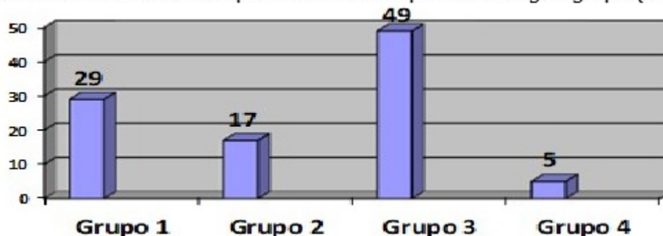
Gráfico 1. Distribución porcentual de los pacientes según grupo (real).

La estratificación de los pacientes de la serie mostró que la mayoría pertenecía al grupo 3 (17 casos, 49 %), que son los que ingresaron por mal control metabólico, o por estado de hiperglucemia aguda no complicada. (Gráfico 1).