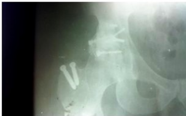
Figura 4. Imagen radiográfica de la cadera afectada, después de realizada la cirugía. Se muestran los tornillos y el alambre de cerclaje empleados en la reconstrucción acetabular así como los tornillos empleados para la fijación del trocánter mayor.

Durante la exploración quirúrgica se constató la presencia de gran lesión del muro y pared posterior, con zonas de gran conminución; en el fondo acetabular existían fragmentos que fueron retirados, la exploración de la cabeza femoral nos mostró daños a nivel del cartílago articular y la desinserción del ligamento redondo.