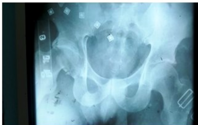
Figura 1. Imagen radiográfica anteroposterior de pelvis ósea donde se observa la fractura luxación posterior de la cadera derecha.

Dicho paciente fue atendido en el momento de su recepción en el área de código rojo, se valoró y se siguió el protocolo vigente para la atención de los pacientes politraumatizados implementado en nuestro centro. Se realizaron radiografías de las zonas afectadas, incluida una tomografía de la pelvis ósea. (Figuras 1,2 y 3).