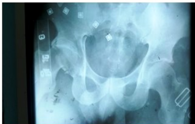
Figura 1. Imagen radiográfica anteroposterior de pelvis ósea donde se observa la fractura luxación posterior de la cadera derecha.

Dicho paciente fue atendido en el momento de su recepción en el área de código rojo, se valoró y se siguió el protocolo vigente para la atención de los pacientes politraumatizados implementado en nuestro centro. Se realizaron radiografías de las zonas afectadas, incluida una tomografía de la pelvis ósea. (Figuras 1,2 y 3).