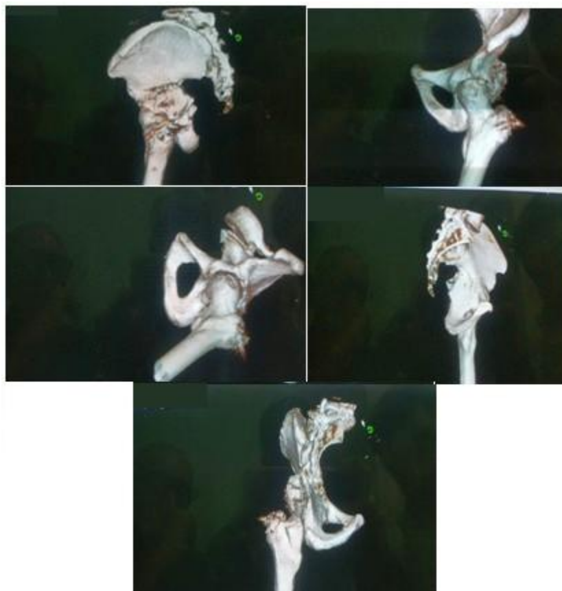
Figuras 5 a 9. Reconstrucciones en 3D realizadas tras la cirugía con el objetivo de mostrar la reducción obtenida con el tratamiento quirúrgico realizado.

El paciente se mantuvo por un periodo de tres meses en descarga tras los cuales comenzó con apoyo parcial con seguimiento radiológico mensual por un periodo de ocho semanas.