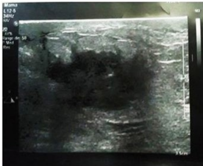
Figura 1. Ultrasonido mamario donde se observa imagen de aspecto nodular, heterogéneo, con centro de baja ecogenicidad y de contornos irregulares que mide 21 X 19 mm de diámetro.

Mamografía bilateral: mamas moderadamente grasas, heterogéneas, llama la atención aumento de la densidad de la mama izquierda con respecto a su homóloga, se observa en el cuadrante inferior externo próximo a la línea media, imagen de aspecto nodular de 20 x 19 mm de contornos irregulares sin