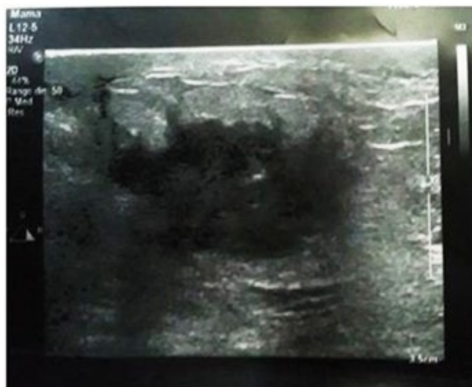
Figura 1. Ultrasonido mamario donde se observa imagen de aspecto nodular, heterogéneo, con centro de baja ecogenicidad y de contornos irregulares que mide 21 X 19 mm de diámetro.

Mamografía bilateral: mamas moderadamente grasas, heterogéneas, llama la atención aumento de la densidad de la mama izquierda con respecto a su homóloga, se observa en el cuadrante inferior externo próximo a la línea media, imagen de aspecto nodular de 20 x 19 mm de contornos irregulares sin