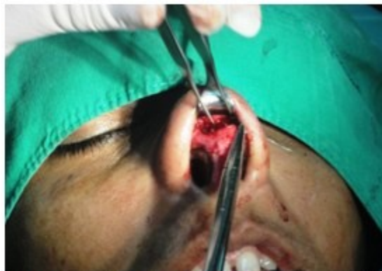
Figura 3. Se observan los cartílagos del domo expuestos.