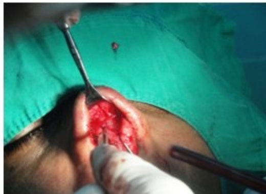
Figura 2. Se avanza exponiendo la estructura anatómica hasta la mitad del ala nasal.