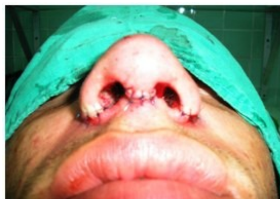
Figura 4. Se observa la sutura en base de la columela y alas nasales para estrechamiento de las narinas.

Las imágenes y datos han sido utilizados previo consentimiento informado a los pacientes. Para la realización del estudio se contó con la aprobación del Consejo Científico de la Institución.