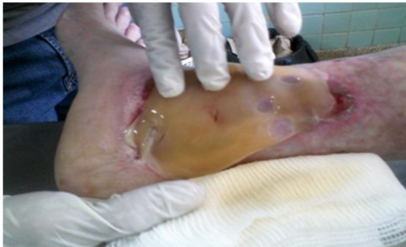
Figura 7. Procedimiento de aplicación del gel de plaquetas autólogo en el área cruenta, ocupando la totalidad de la superficie afectada.

Una tercera cura y autoinjerto libre de piel de grosor mediano, se realizó el 2 de mayo de 2014. (Figura 9). Pasados tres días (5 de mayo de 2014) el área injertada fue descubierta y curada por primera vez; mostraba exudación característica de coloración verdosa y olor sui géneris. (Figuras 10 y 11). Se utilizó la gentamicina en crema como protector local. Se realizaron curas alternas de forma ambulatoria hasta el día del alta, el 26 de mayo de 2014. (Figura 12). Al valorar el resultado final, se constató cicatrización efectiva y de características duraderas en más del 70 % del área afectada inicialmente. (Figura 13).