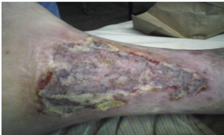
Figura 11. Aspecto y características del injerto libre de piel al tercer día de evolución tras la primera curación.