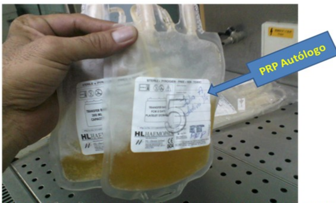
Figura 6. PRP autólogo, producto final del proceso, listo para conservar en refrigeración hasta el momento de la aplicación sobre el lecho ulceroso.