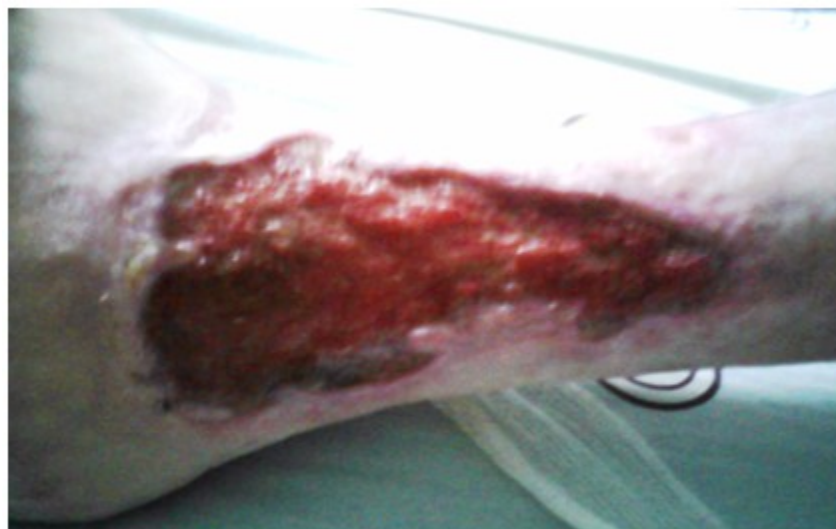
Figura 1. Estado de la úlcera antes de iniciar el tratamiento.

Durante años le acompañaron regímenes terapéuticos a continuación relacionados: compresión elástica junto al reposo elevado de miembros para evitar la estasis venosa; flebotónicos; curas seriadas por largos periodos de tiempo, con exposición prolongada a medicamentos que ya no podía utilizar; tratamiento quirúrgico de la afectación vascular existente; secuencia de ozonoterapia local y sistémica; tratamiento antimicrobiano por años, con efectos adversos (gastrointestinales), presentes en ese momento.