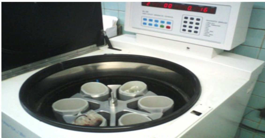
Figura 2. Centrífuga refrigerada marca DL 6M®, con la cual se realiza el proceso de centrifugación de los componentes sanguíneos para la obtención del PRP.