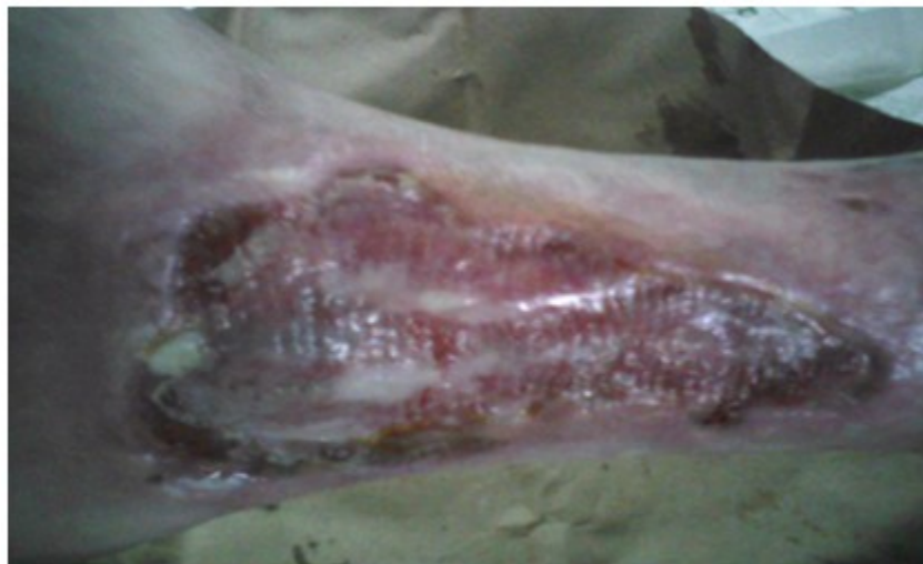
Figura 8. Aspecto adquirido por el gel de plaquetas hasta aproximadamente los cinco días.