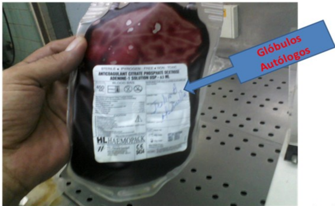
Figura 5. Serie roja (glóbulos rojos autólogos) ya separada y lista para ser repuesta nuevamente sin afectar la hemodinamia del paciente.