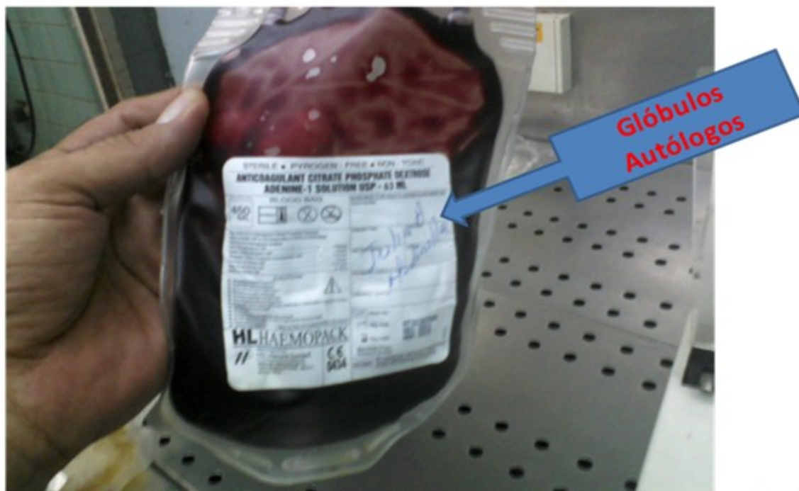
Figura 5. Serie roja (glóbulos rojos autólogos) ya separada y lista para ser repuesta nuevamente sin afectar la hemodinamia del paciente.