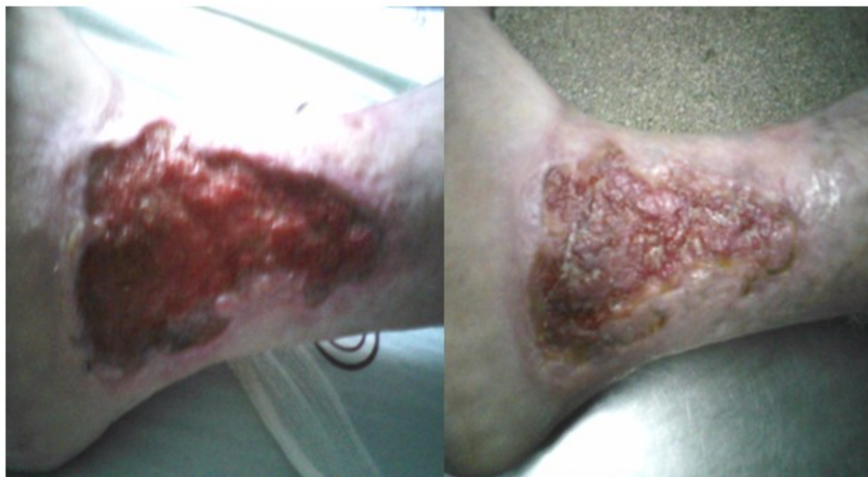
Figura 13. Úlcera posflebítica de 35 años de evolución antes (izquierda) y después (derecha: lesión residual tras tratamiento con PRP y autoinjerto de piel).