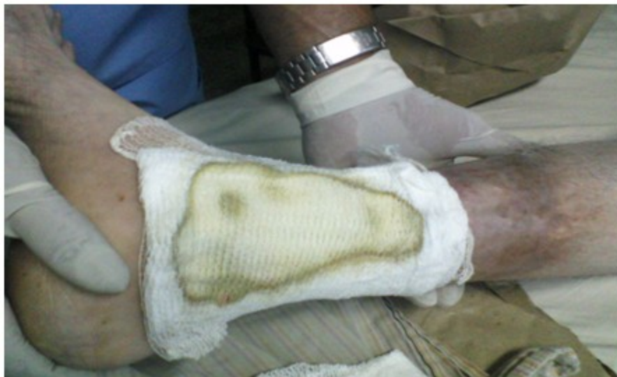
Figura 10. Se observa la exudación característica por el gel de plaquetas (coloración verdosa).