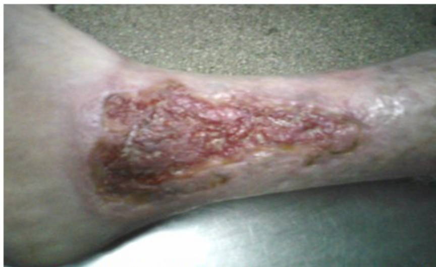
Figura 12. Aspecto del área cruenta a los 24 días de evolución. Aunque existió pérdida del injerto, se observan yemas de epitelización en cerca del 70 % del área cruenta valorada inicialmente.