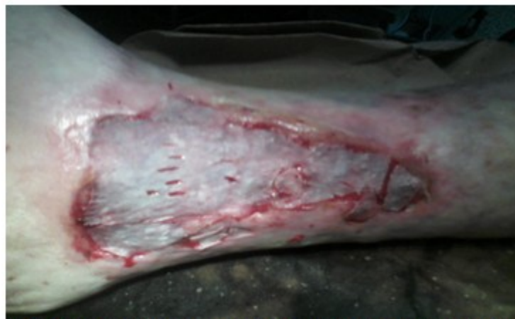
Figura 9. Se observa el injerto de piel de grosor mediano tipo laminar con pequeños cortes para el drenaje de posibles hematomas; fijación por aposición.