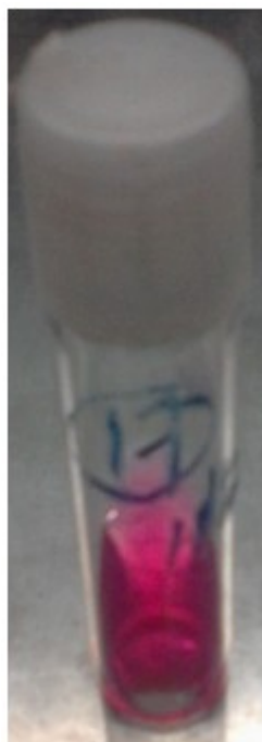
Figura 2. Imagen donde se observa el color rosado intenso en el medio de cultivo urea porque este microorganismo produce la enzima ureasa.

A la paciente se le había retirado el Aciclovir agregándose el Anfotericin b, siguió con deterioro de la conciencia y estado de coma. No se recogieron signos de hipertensión endocraniana en la resonancia magnética. El día 21 de febrero falleció. Se recogió en la necropsia el hallazgo de una neoplasia oculta.