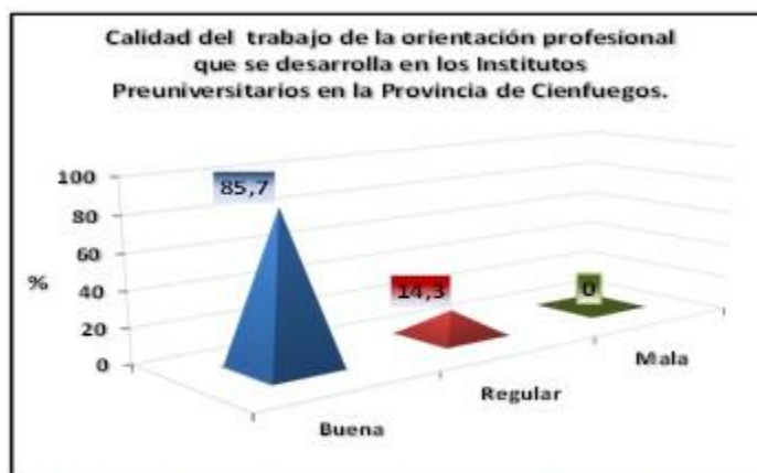
Gráfico 1. Calidad del trabajo de orientación profesional realizado según opinión de los Consejos de Dirección de los institutos preuniversitarios

Los consejos de dirección de 18 preuniversitarios (85,7 %) consideran que el trabajo de orientación vocacional desarrollado con los estudiantes al implementar el sistema de acciones es bueno, mientras que los institutos preuniversitarios Owen Fundora, Armando Mestre y Juan Alberto Díaz lo evalúan de regular (14,3 %), refiriendo que la lejanía de la cabecera municipal es la principal causa. (Gráfico 1).