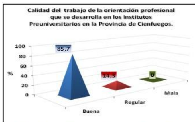
Gráfico 1. Calidad del trabajo de orientación profesional realizado según opinión de los Consejos de Dirección de los institutos preuniversitarios

Los consejos de dirección de 18 preuniversitarios (85,7 %) consideran que el trabajo de orientación vocacional desarrollado con los estudiantes al implementar el sistema de acciones es bueno, mientras que los institutos preuniversitarios Owen Fundora, Armando Mestre y Juan Alberto Díaz lo evalúan de regular (14,3 %), refiriendo que la lejanía de la cabecera municipal es la principal causa. (Gráfico 1).