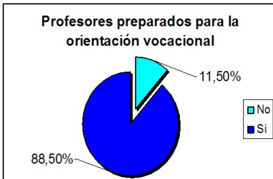
Gráfico 3. Percepción de profesores sobre su preparación para la orientación vocacional

El 87,6 % de los profesores (92) participaron con los estudiantes en las actividades de orientación vocacional que se planificaron y consideran que estas actividades preparan al estudiante para las pruebas de aptitud y posteriormente para una buena elección de la carrera, pues las actividades conciben el desarrollo de habilidades, conocimientos necesarios para responder las preguntas que se hacen en la prueba de actitud y los preparan para ser un buen profesional.