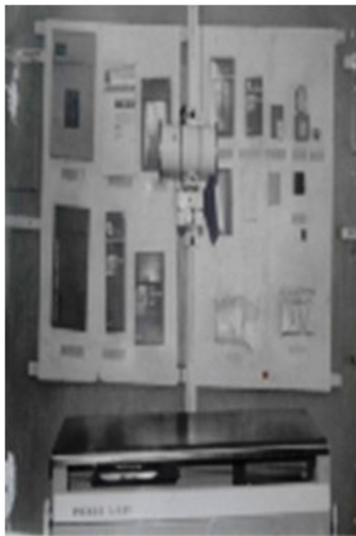
Figura 9. Equipo de rayos x convencional marca Picker.