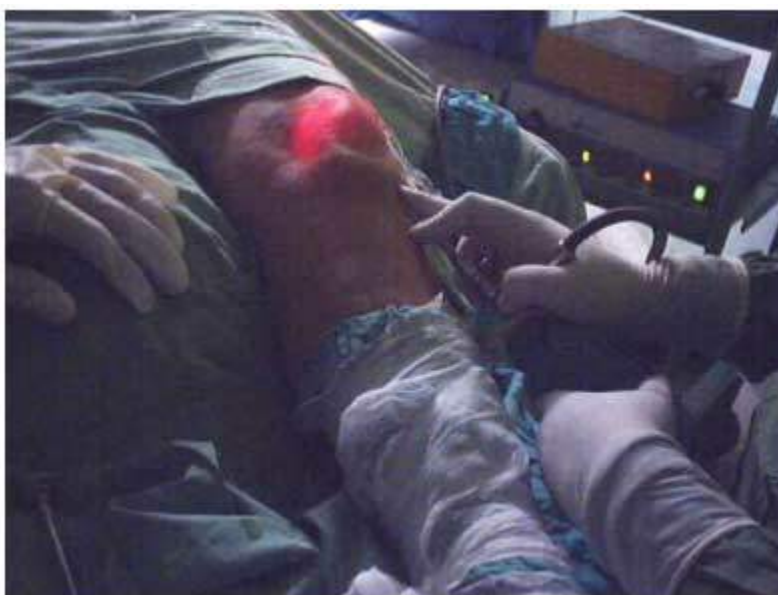
Figura 4. Punto de introducción del artroscopio.

15 minutos para comenzar el proceder, previa prueba de analgesia de la zona. Se introdujo artroscopio preferentemente en el portal inferior externo. (Figura 4)