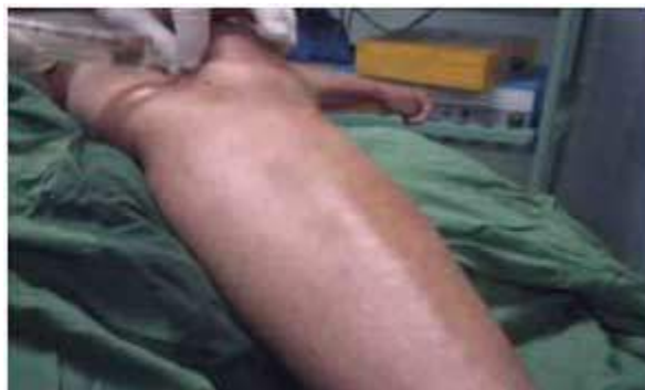
Figura 3. Inyección de bupivacaína en el portal superior interno.

En la piel y el tejido celular subcutáneo, a nivel del portal donde se introdujo el artroscopio se aplicó bupivacaína 5 ml al 0,25 % Se esperaron