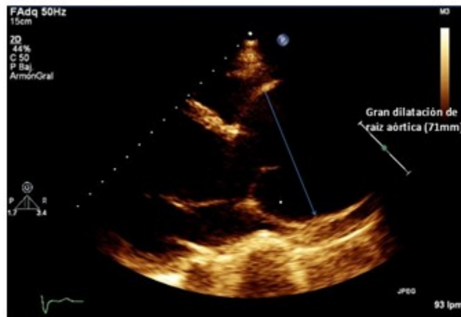
Figura 1. Imagen n1 o panel A: Vista paraesternal de eje largo del modo bidimensional en la ecocardiografía transtorácica donde se muestra una raíz aórtica muy dilatada sin imagen de disección.

transtorácica, (Figura 1), se observó una gran dilatación de la raíz aórtica (71mm). En la imagen (n2), con el Doppler codificado en color, se observó un gran chorro de regurgitación aórtica secundario a la dilatación del anillo, que sobrecarga volumétricamente el ventrículo izquierdo. (Figura 2). En otra imagen (n3) de vista supraesternal de grandes vasos, pudo identificarse la inversión holodiastólica del flujo en la aorta descendente torácica, criterio patognomónico de insuficiencia aórtica severa. (Figura 3).