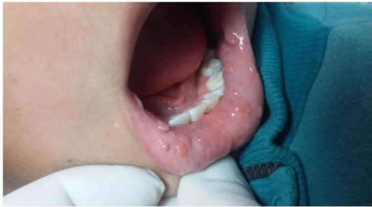
Figura 3. Lesiones papulomatosas con tendencia a agruparse en mucosa de los labios.

El estudio anatomopatológico, realizado el 2 de julio del 2015, reportó lesión exofítica benigna, revestida por epitelio escamoso con acantosis, papilomatosis e hiperqueratosis, con un estroma de vasos sanguíneos congestivos, cambios que guardan relación con los encontrados en la enfermedad de Heck.