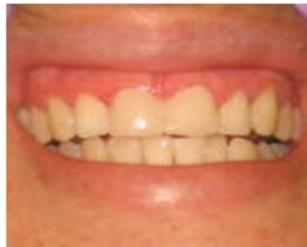
Figura 7. Imagen que muestra el aspecto de los dientes 11 y 21 después del pulido final.

8. Después que polimerizó el material, se quitó la matriz, se exploró cuidadosamente el margen y se eliminaron los excesos con fresas de diamante. El acabado se realizó con discos de pulido de grano fino, gomas abrasivas del kit de pulido. Por los espacios interdentarios se pasaron tiras de pulir, pero sin destruir la relación de contacto. (Figuras 6 y 7).