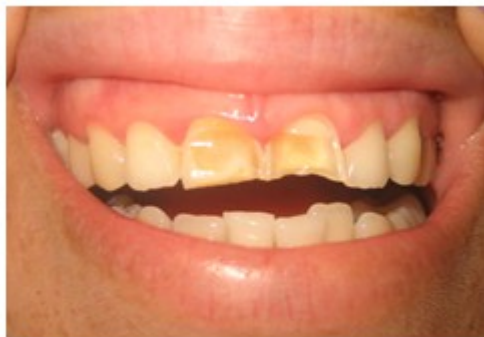
Figura 1. Imagen que muestra pérdida del tejido dentario en 11 y 21 con dentina expuesta. Hipomineralización de 11 y 21.

Diagnóstico clínico: hipomineralización del esmalte.