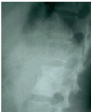
Figura 3. Radiografía de columna lumbosacra desde una vista lateral.

Se concluyó el diagnóstico como tuberculosis extrapulmonar (mal de Pott).