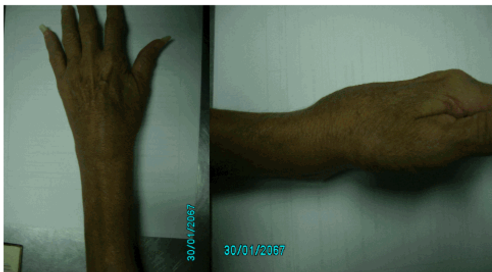
Figuras 1 y 2. Aspecto de la mano afectada en que se observó lo llamativo de la deformidad marcada del extremo distal del radio.

Era llamativo el aspecto de la muñeca afectada, pues se constató una deformidad en su cara dorsal, con signo de los radiales visible en la vista anteroposterior. (Figuras 1 y 2).