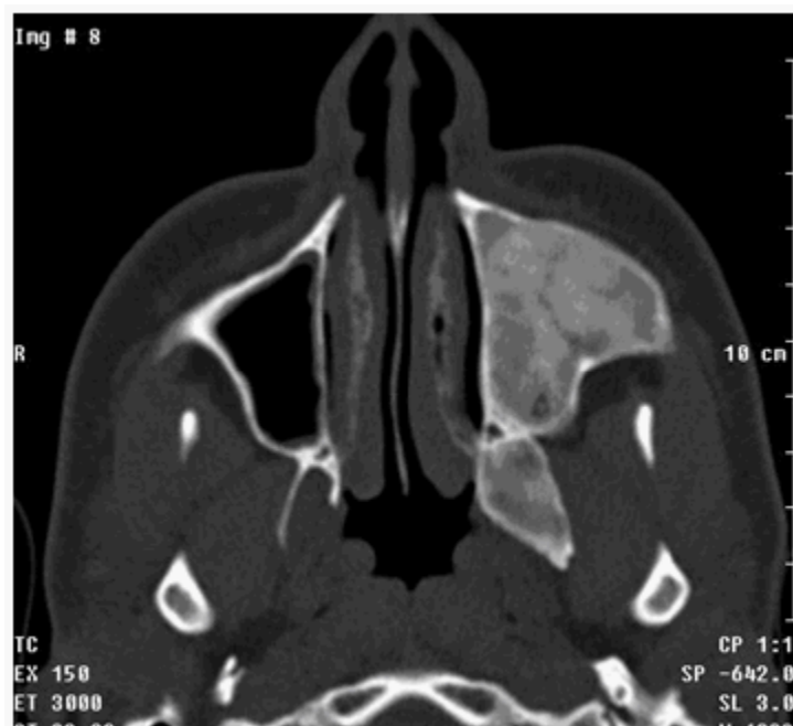
Figura 3. Ocupación del seno maxilar izquierdo por masa hiperdensa parcialmente calcificada