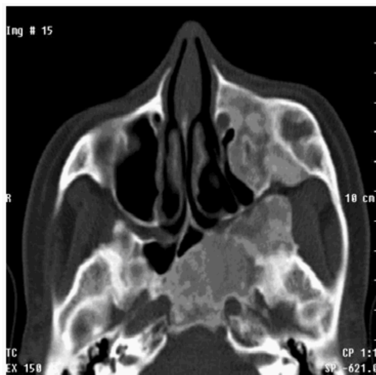
Figura 4. Masa hiperdensa que se extiende a fosa pterigopalatina y seno esfenoidal

La paciente se envió al Servicio de Otorrinolaringología del centro asistencial, donde decidieron realizar biopsia de la lesión, la cual confirmó la sospecha tomográfica de displasia fibrosa, la conducta seguida fue expectante con seguimiento clínico y tomográfico. Actualmente la paciente se encuentra asintomática.