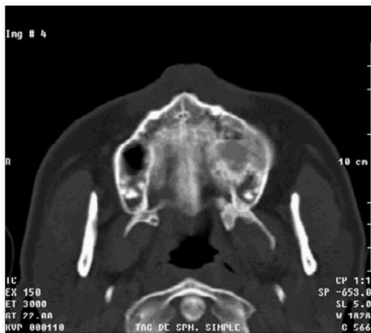
Figura 2. Insuflación de la rama izquierda del maxilar superior, por masa procedente del seno maxilar