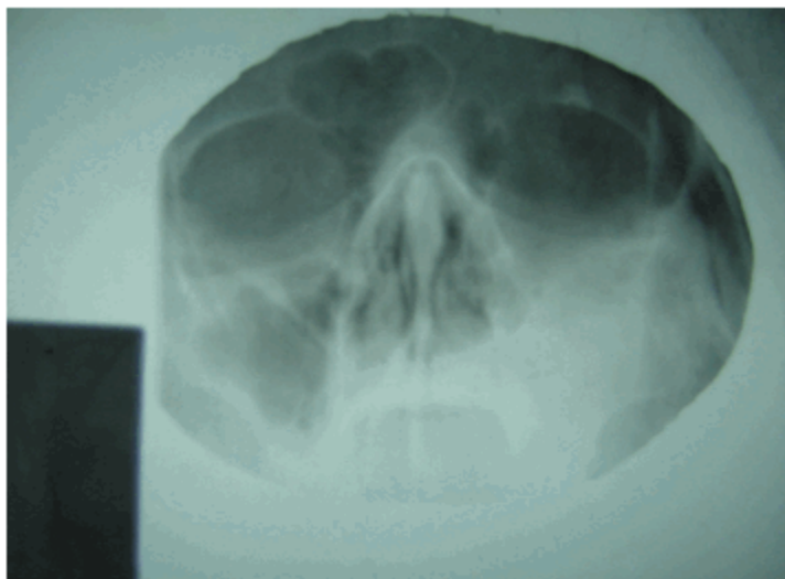
Figura 1. Radiografía de senos paranasales, vista de Water que muestra velamiento del seno maxilar izquierdo con opacidad que se acerca a la del tejido óseo.

Paciente femenina, de 26 años de edad, sin antecedentes de interés, la cual presentaba molestias faciales y secreción nasal. Al examinarla mostraba ligera deformidad facial izquierda con aumento de volumen de ese lado, sin dolor ni signos inflamatorios. Se le realiza radiografía de senos paranasales en vista de Water que muestra velamiento del seno maxilar izquierdo con opacidad que se acerca a la del tejido óseo. (Figura 1)