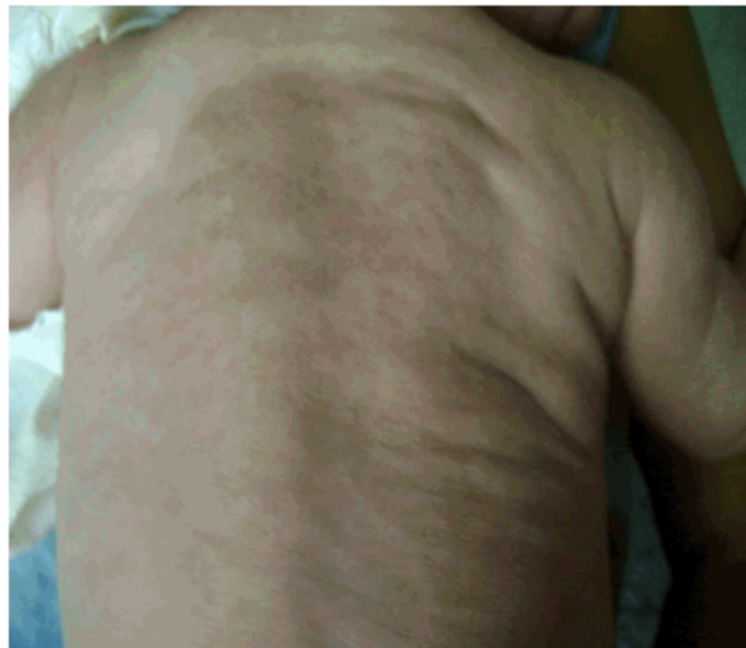
Figura 1. Región posterior del tronco, donde se observa placa infiltrada eritemato-violácea, de consistencia firme y superficie de aspecto abollonado.

Se observó cuadro cutáneo diseminado, constituido por placa infiltrada eritemato-violácea, de consistencia firme y superficie de aspecto abollonado, que asienta en región posterior del tronco, cubriéndolo casi totalmente (Figura 1). Se constataron además nódulos eritematosos a nivel de cadera derecha y región posterior de los muslos, cuyo tamaño oscilaba entre 1 a 3 cm. (Figura 2)