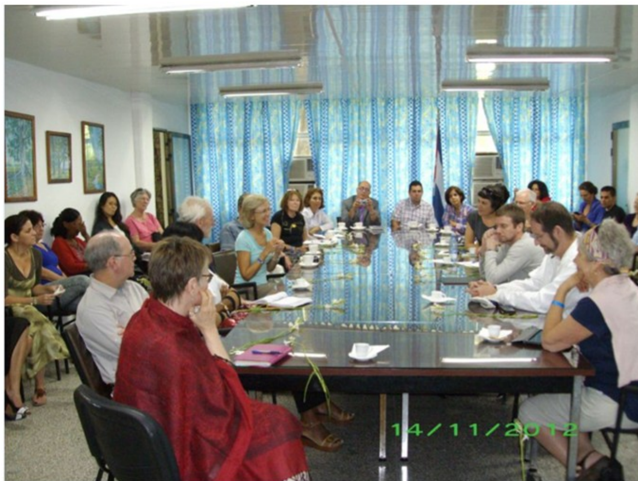
Fig. 5. Imagen del encuentro con importantes editores de revistas internacionales.