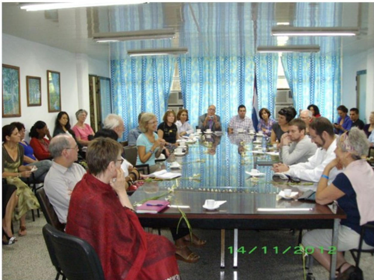
Fig. 5. Imagen del encuentro con importantes editores de revistas internacionales.