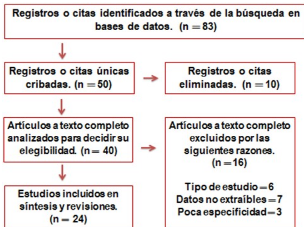
Figura 1. Diagrama de flujo para el proceso de búsqueda.

con los criterios de inclusión declarados en el estudio.