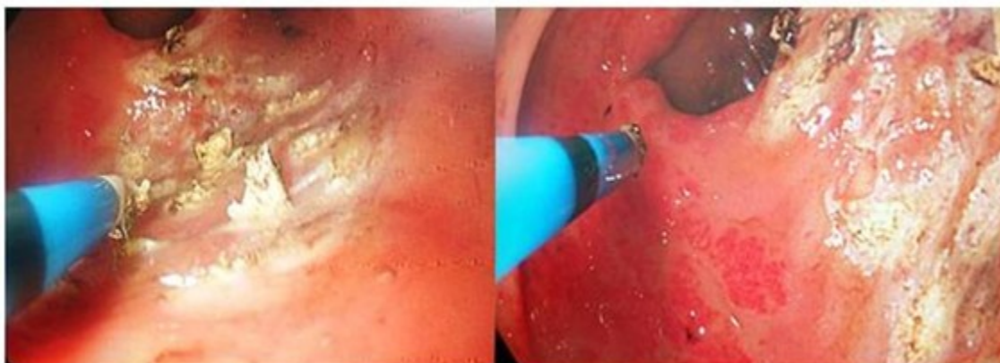
Figura 2: Tratamiento endoscópico con coagulación con argón plasma.

Se le dio seguimiento durante 6 meses, posterior a la última sección de endoscopia terapéutica no