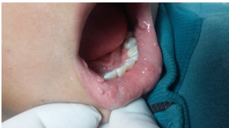
Figura 3. Lesiones papulomatosas con tendencia a agruparse en mucosa de los labios.

El estudio anatomopatológico, realizado el 2 de julio del 2015, reportó lesión exofítica benigna, revestida por epitelio escamoso con acantosis, papilomatosis e hiperqueratosis, con un estroma de vasos sanguíneos congestivos, cambios que guardan relación con los encontrados en la enfermedad de Heck.