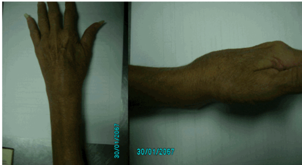
Figuras 1 y 2. Aspecto de la mano afectada en que se observó lo llamativo de la deformidad marcada del extremo distal del radio.

Era llamativo el aspecto de la muñeca afectada, pues se constató una deformidad en su cara dorsal, con signo de los radiales visible en la vista anteroposterior. (Figuras 1 y 2).