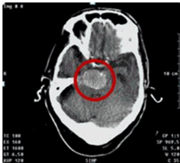
Figura 1. Imagen de TAC de cráneo que muestra lesión hiperdensa en tallo cerebral.

Resonancia magnética nuclear (RMN) de cráneo: Sinusopatía esfenoidal izquierda. Hiperintensidades periventriculares de sustancia blanca subcortical en relación con leucoaraiosis. Imagen redondeada de intensidad variable, de 31x25 mm, comprimiendo el cuarto ventrículo; dicha imagen, acompañada de dilatación de todo el sistema ventricular supratentorial, cambios en relación con posible tumoración cerebral.