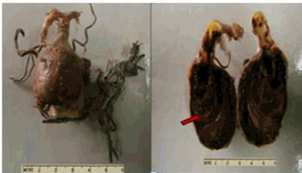
Figura 4. Aneurisma aterosclerótico desarrollado en unión de la arteria basilar con la arteria cerebelosa superior. En el corte sagital la flecha indica la trombosis oclusiva.

El examen microscópico de la lesión vascular correspondió con cambios histológicos ateroscleróticos. Se demostraron irregularidades fibrocalcificadas en el espesor de la pared arterial, así como depósitos de colesterol, zonas de adelgazamiento extremo que alternaban con las engrosadas y destrucción amplia de la íntima con presencia de macrófagos espumosos.