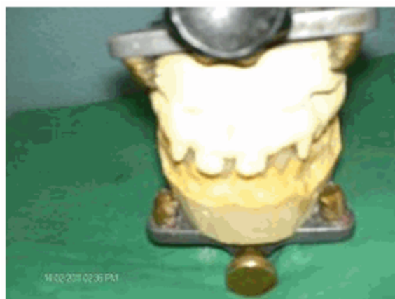
Figura 10. Análisis de la oclusión dentaria.

El seguimiento de este paciente se realizó en la consulta, llevando la rehabilitación según sus requerimientos, velando periódicamente la necesidad del cambio de la prótesis hasta tanto el crecimiento y desarrollo normal de los