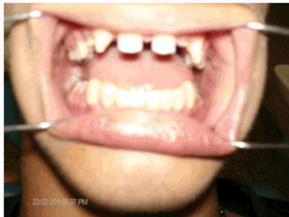
Figura 11. Instalación.