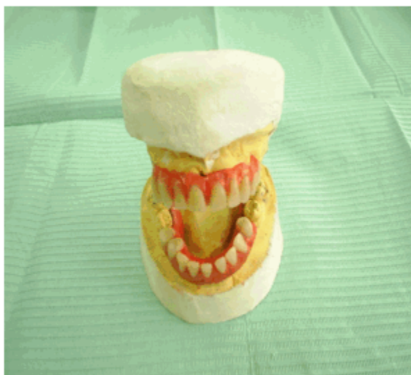
Figura 6. Montaje de dientes de la sobredentadura parcial superior y de la prótesis parcial inferior del segundo caso.

sobredentadura parcial superior y prótesis parcial removible inferior. (Figuras 6 y 7). La sobredentadura se colocó sin realizar preparaciones dentarias y con retenedores labrados en los molares presentes.