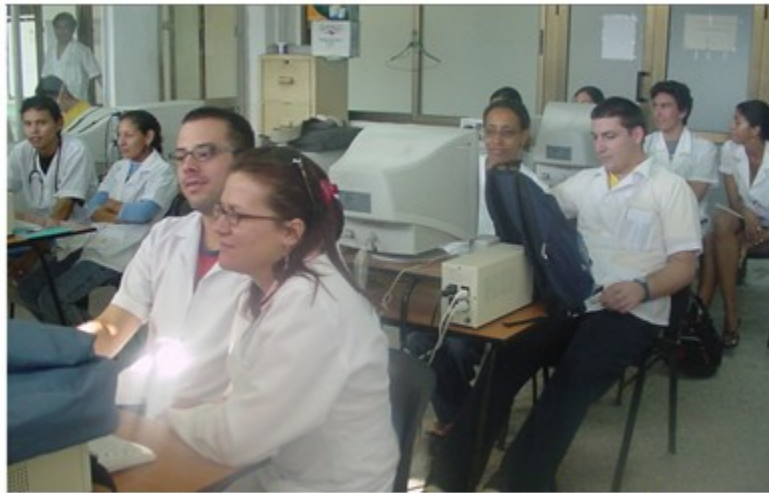
Fig. 3. Estudiantes internos trabajando con simulaciones en la estancia de Pediatría.