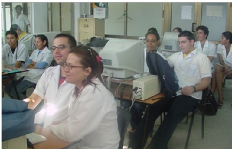
Fig. 3. Estudiantes internos trabajando con simulaciones en la estancia de Pediatría.