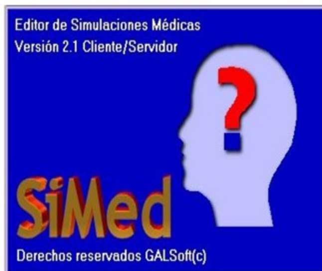
Fig. 2. SiMed: imagen de presentación del módulo de trabajo del estudiante (módulo de ejecución)

De esta manera, SiMed constituyó una herramienta que permitía, en un ambiente de trabajo profesor-estudiante-computadora muy atractivo, la elaboración y aplicación de simulaciones clínicas que posibilitaban un entrenamiento más aproximado a la lógica real del proceso asistencial, a la vez que permitía la incorporación de múltiples recursos didácticos como son el empleo de sonidos (latidos cardiacos, soplos), imágenes (radiografías, electrocardiogramas) y videos (la marcha de un paciente, por ejemplo).