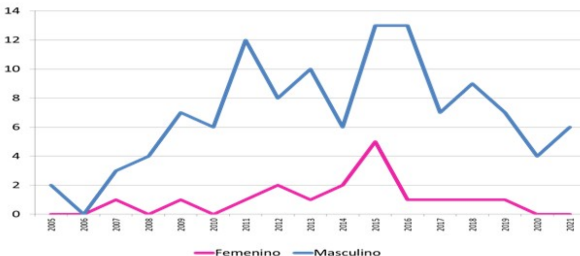
Gráfico 2. Caracterización de los pacientes con diagnóstico de infección por VIH/sida de 50 años y más según sexo e incidencia anual. Cienfuegos 1986 al 2021

El sexo masculino aportó el mayor número de casos, con mayor incidencia en los años 2015, 2016. (Gráfico 2).