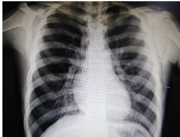
Fig. 1. Radiografía de tórax posteroanterior de pie. Las flechas rojas señalan el neumomediastino y la azul el enfisema subcutáneo.

Radiografía de tórax posteroanterior de pie, en la cual se identifica imagen radiotransparente en partes blandas de la región del tórax. Línea radiotransparente que contornea la silueta cardiaca izquierda. (Fig. 1).