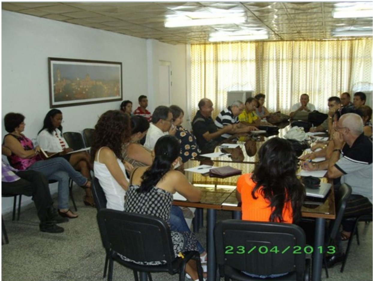
Fig. 4. Imagen del IV Taller Regional de Publicaciones Científicas. Cienfuegos, 2013.