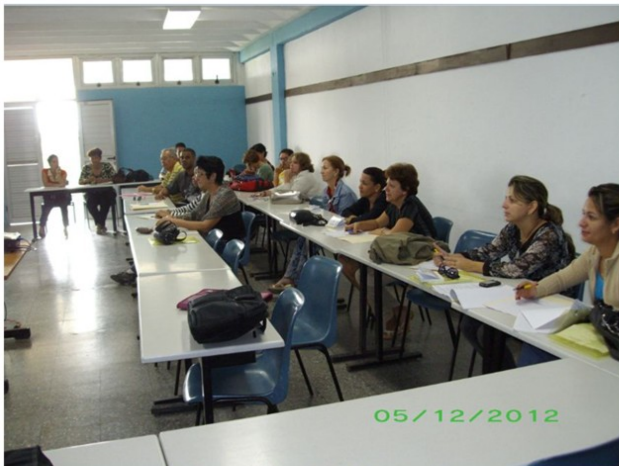
Fig. 3. Imagen de la capacitación realizada en Pinar del Rio. Año 2012.