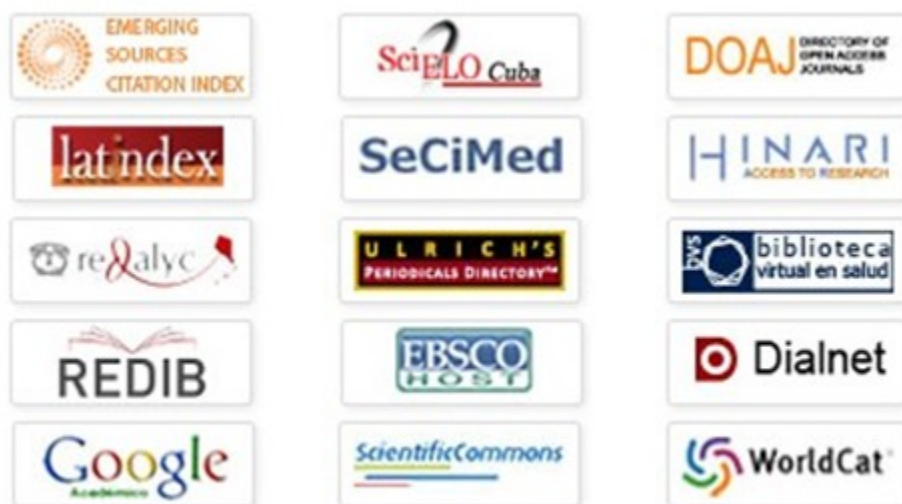
Fig. 6. Bases de datos donde está indexada Medisur.

La capacidad innovadora de Medisur siguió desarrollándose y fue pionera también en los procesos y desarrollo de nuevos programas para destacar los artículos más relevantes, para hacer del proceso editorial una actividad continua, así como para mostrar los artículos más vistos y citados. Al interior de la revistas se desarrollaron sistemas dinámicos para construir HTML y PDF