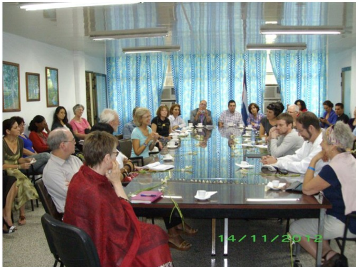
Fig. 5. Imagen del encuentro con importantes editores de revistas internacionales.