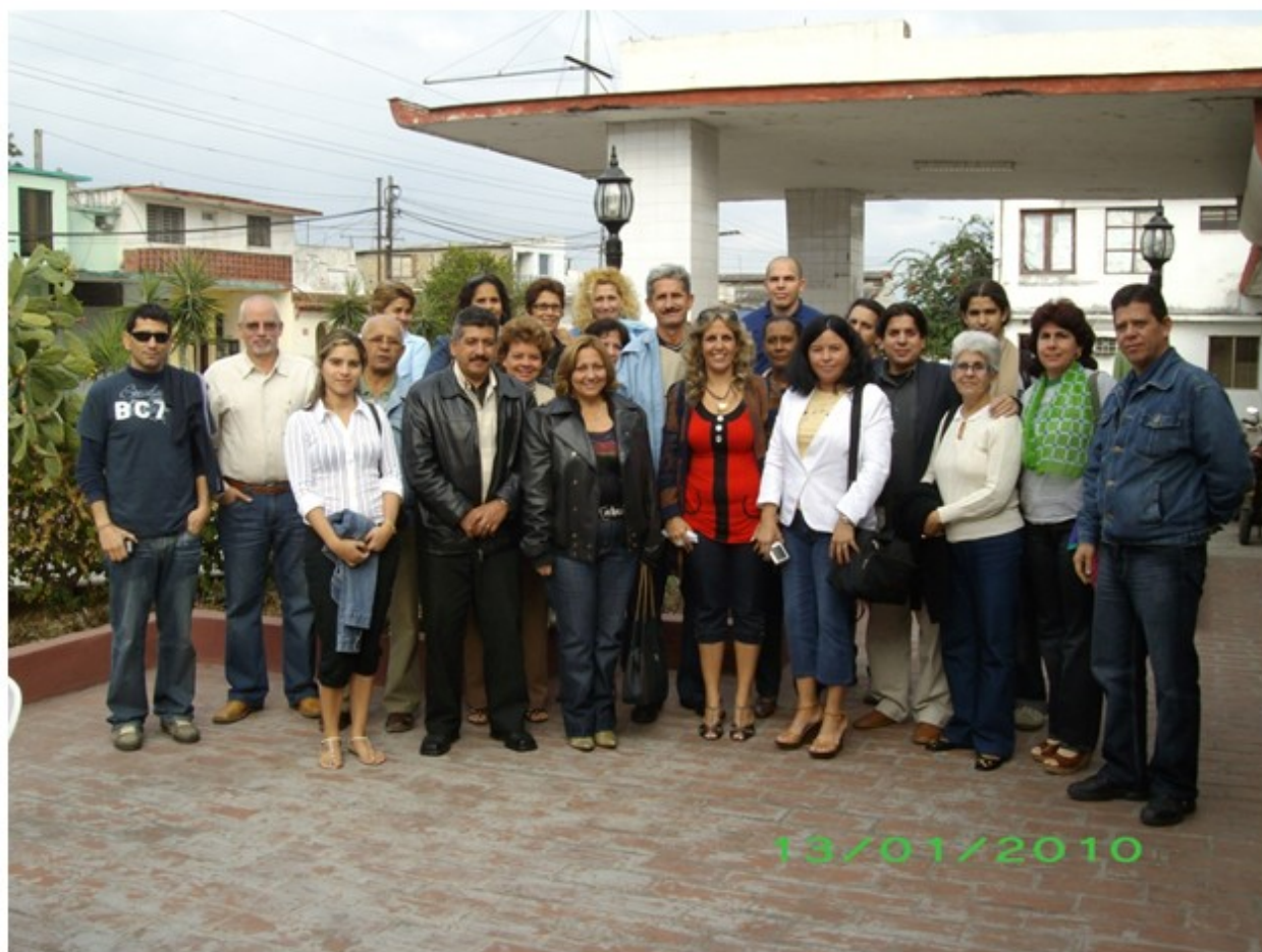
Fig. 1. Imagen que muestra participantes en la reunión de editores de las revistas médicas y los directores de los Centros Provinciales de Información de Ciencias Médicas en Villa Clara.