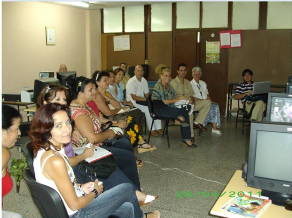
Fig.2. Imagen de la capacitación realizada en Santa Clara. Año 2011.

tecnología de OJS y también con aspectos novedosos relacionados con el proceso editorial. Recibió, además, la visita de importantes editores de revistas internacionales (Fig. 2, Fig. 3, Fig. 4 y Fig. 5).