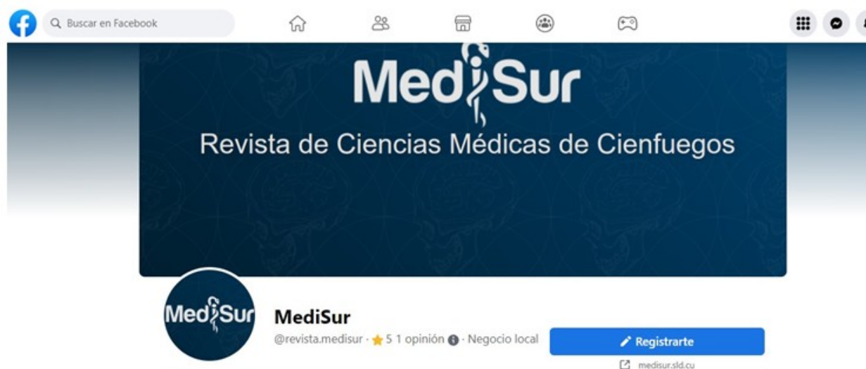
Fig. 7. Imagen de Medisur en Facebook.

Medisur también fue la primera revista científica cubana en indexar sus contenidos en redes sociales como Twitter o Facebook, lo que favoreció su divulgación y también la socialización pública de la ciencia, aspecto tan importante en nuestros días. (Fig. 7 y Fig. 8).