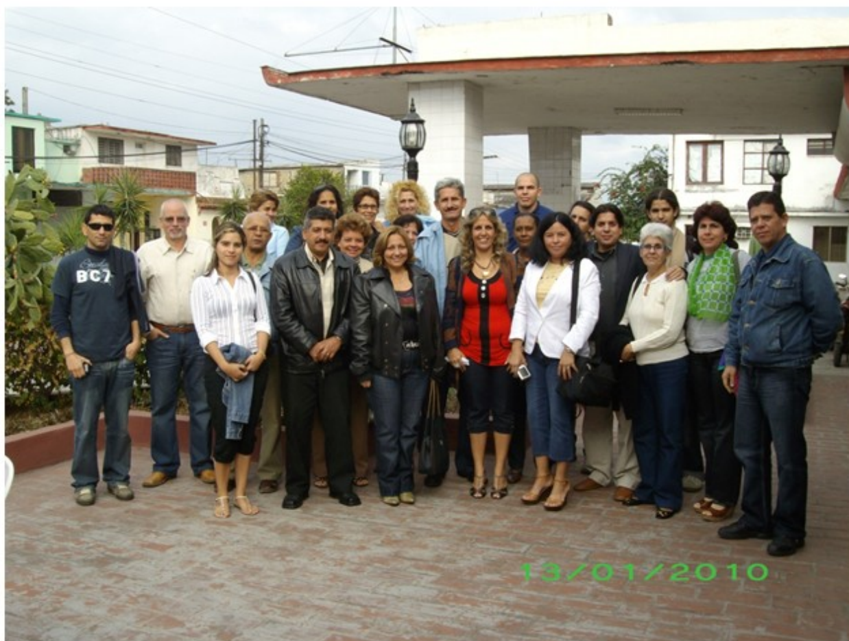
Fig. 1. Imagen que muestra participantes en la reunión de editores de las revistas médicas y los directores de los Centros Provinciales de Información de Ciencias Médicas en Villa Clara.