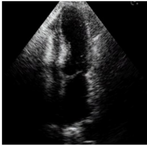
Fig. 2. Ecocardiograma al momento del ingreso. Se observa balonamiento apical del ventrículo izquierdo.

En el electrocardiograma (EKG) se identificaron ondas T negativas en D1, AVL, V5 y V6. (Fig. 3).