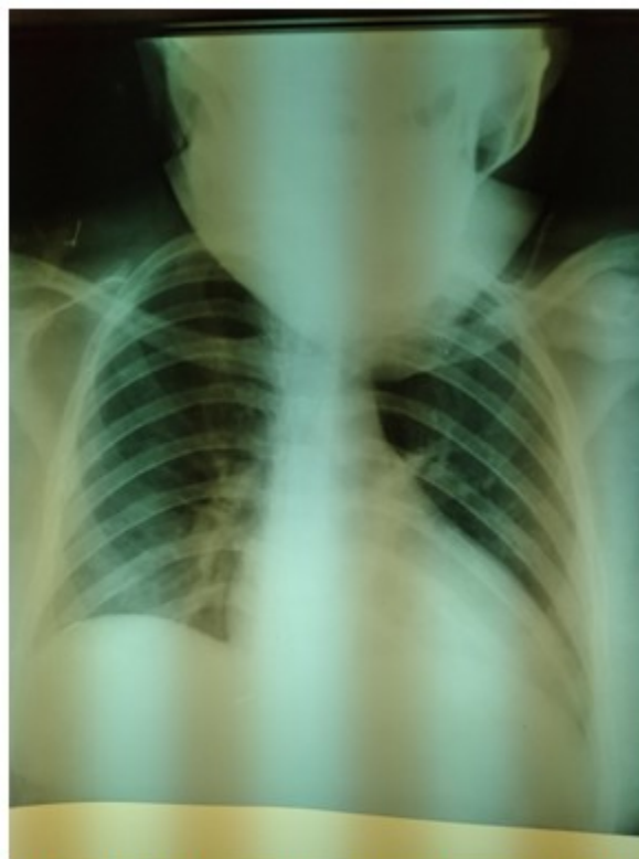
Fig. 4. Radiografía tomada a las 24 horas de tratamiento en la UCIP. Se observa mejoría evidente de la congestión pulmonar.

Al tercer día del ingreso, el ecocardiograma mostró mejoría evidente de la contractilidad y fue posible retirar la ventilación mecánica. Una vez suspendido el apoyo inotrópico, se comenzó tratamiento con enalapril y espironolactona orales, y se transfirió para sala convencional de cardiología al quinto día de estadía en cuidados intensivos. La FEVI al momento de ser transferida era del 60 % y el EKG no mostró alteraciones.