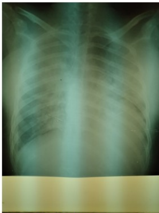
Fig. 1. Radiografía al ingreso. Se observan lesiones hiliofugales bilaterales extensas de aspecto congestivo, típicas de edema pulmonar.

El examen físico inicial reveló palidez, sudoración importante, agitación, cianosis, polipnea (FR: 40 rpm), retracciones intensas, taquicardia (173 lpm), hipotensión (80/50) y SpO 2 de 88,7 %. Fue necesario intubarla y ventilarla mecánicamente de urgencia y establecer apoyo inotrópico con epinefrina. Además, se indicó antibioticoterapia enérgica y de amplio espectro, como la combinación de meropenem y vancomicina, por la sospecha de un choque séptico como causa del cuadro.