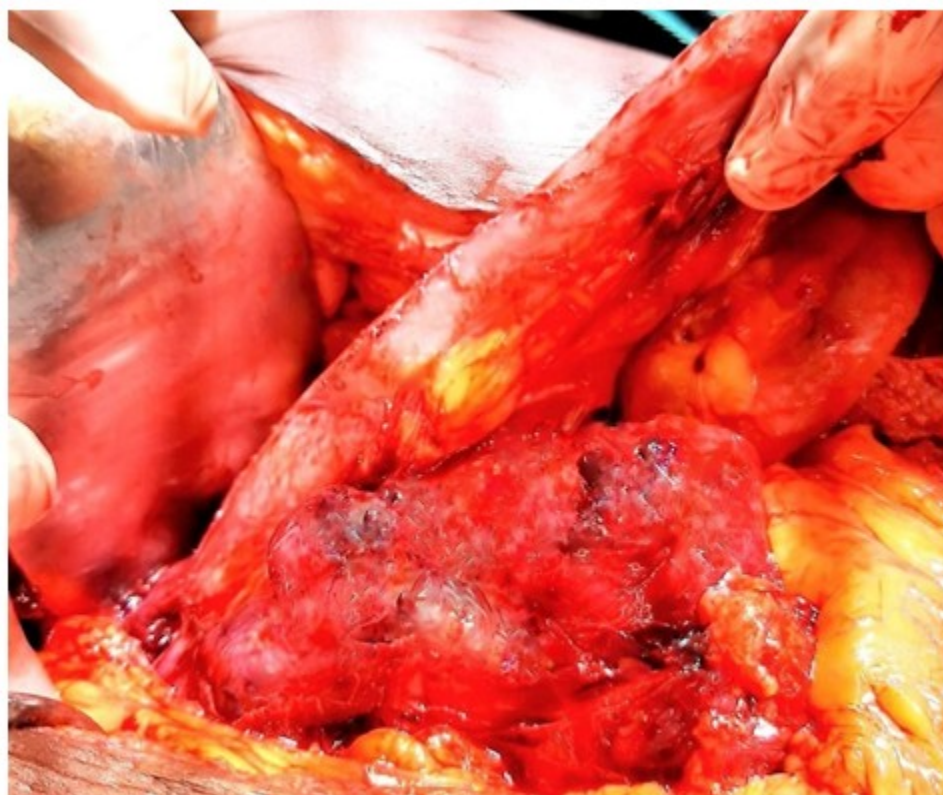
Fig. 3. Masa tumoral que parte de la cuarta porción del duodeno y engloba las primeras asas yeyunales.

En su descenso en el retroperitoneo, el tumor engloba al uréter izquierdo y presenta varias cavidades con material necrótico, y alcanza la fosa iliaca izquierda. (Fig. 3).