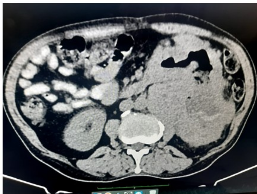
Fig. 1. Topografía de flanco izquierdo. Retroperitoneal y anterior al riñón izquierdo se observa masa heterodensa voluminosa de contornos irregulares y centro hipodenso (sugestivo de necrosis). Compresión de uréter izquierdo, que ocasiona ligera hidronefrosis. Plano de clivage con músculo psoas, riñón y estructuras vasculares vecinas.

Tomografía axial computadorizada (TAC) de abdomen con contraste: como detalle sobresaliente se informa la presencia de una masa voluminosa heterodensa de contornos irregulares en el polo inferior del riñón izquierdo que mide 13,8 \times 9,4 cm en sus ejes mayores axiales, áreas hipodensas sugestivas de necrosis. (Fig. 1 y Fig. 2).