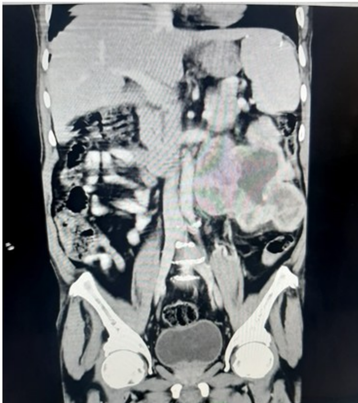
Fig. 2. Masa tumoral que se extiende por debajo del riñón y llega a la línea media, en su extremo inferior alcanza la fosa ilíaca izquierda. Moderada ureterohidronefrosis en riñón izquierdo, probablemente por compresión externa.

Colonoscopia: hemorroides internas grado I. Divertículos en colon sigmoides.