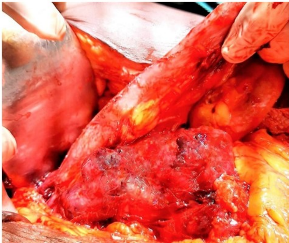
Fig. 3. Masa tumoral que parte de la cuarta porción del duodeno y engloba las primeras asas yeyunales.

En su descenso en el retroperitoneo, el tumor engloba al uréter izquierdo y presenta varias cavidades con material necrótico, y alcanza la fosa iliaca izquierda. (Fig. 3).