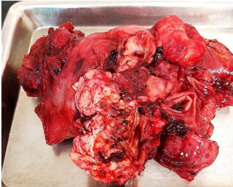
Fig. 4. Pieza operatoria. Se identifica masa tumoral que engloba asas yeyunales, áreas de hemorragia, necrosis y ulceración tumoral.

gastrointestinal, mediante una duodeno-yeyunostomía latero-lateral retrocólica, duodeno en su segunda porción y asa yeyunal que se asciende después de haber obtenido 5 cm de yeyuno distal libre de tumor, se cierra el cabo yeyunal que se asciende en su porción terminal como parte del procedimiento. Después de revisar la hemostasia, se colocan drenajes por contra abertura y se cierra por planos. (Fig. 4).