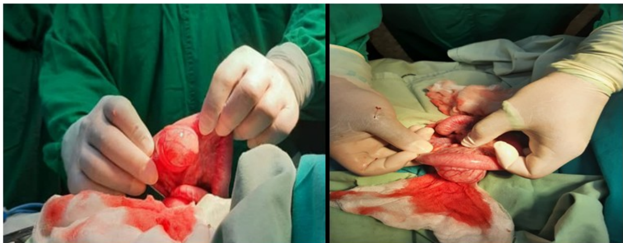
Fig. 3 Piezas quirúrgicas de la duplicidad intestinal quística no comunicante.

encontraba en el borde mesentérico, mediante resección y anastomosis termino-terminal. El estudio histológico informó la presencia de duplicidad intestinal ileal con presencia de tejido pancreático y gástrico heterotópico. (Fig.3).