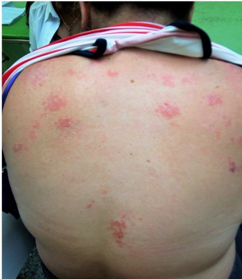
Fig. 2- Las lesiones mostraban tendencia a agruparse, formando placas, distribuidas en la parte superior de la espalda.