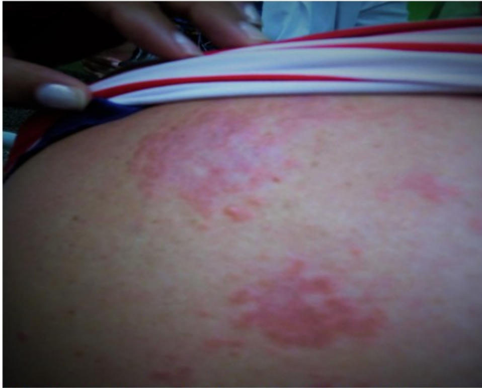
Fig. 1- Lesiones papulares eritematosas, translúcidas e infiltradas.