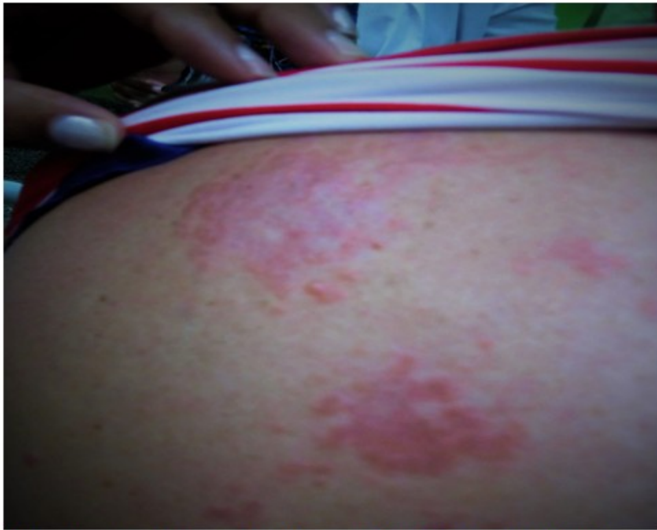
Fig. 1- Lesiones papulares eritematosas, translúcidas e infiltradas.