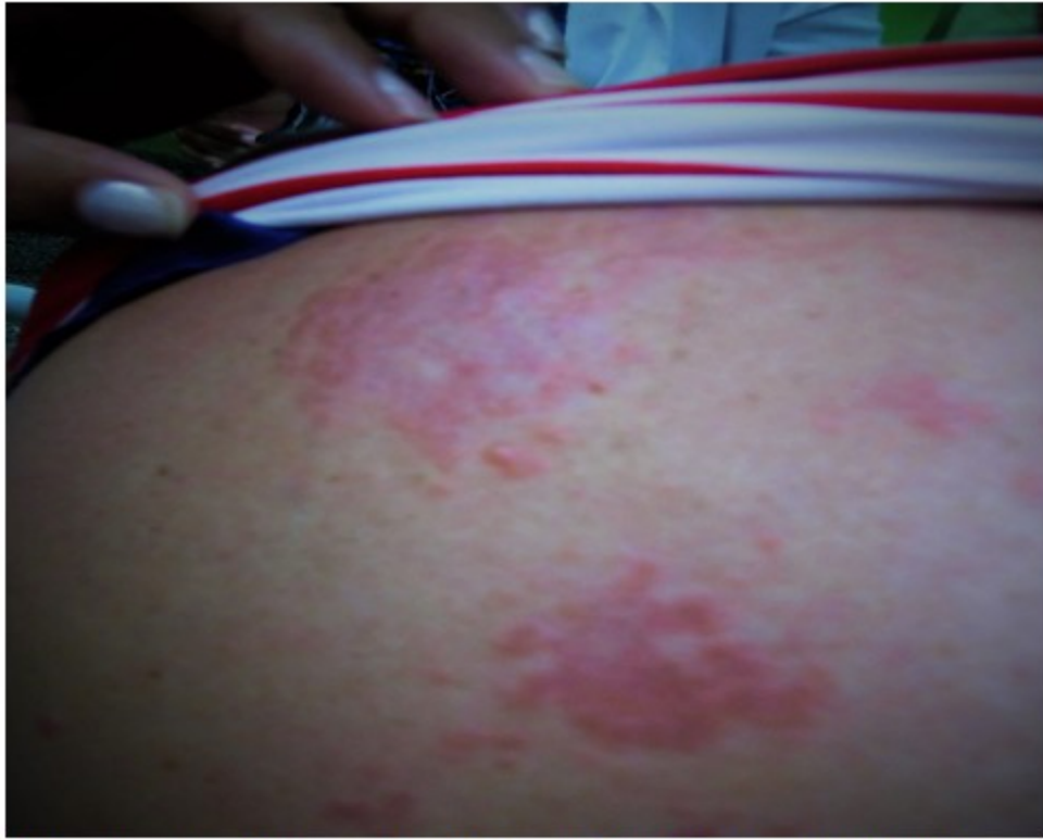
Fig. 1- Lesiones papulares eritematosas, translúcidas e infiltradas.