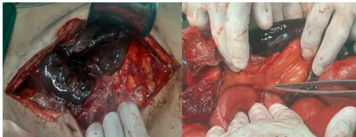
Fig. 2- Imagen derecha: Asas intestinales delgadas con compromiso vascular. Imagen izquierda: Anillo herniario.

proximal. (Fig. 2). No se evidenció ruptura del pseudoquiste. Se realizó colecistectomía, drenaje del PP, necrosectomía pancreática, resección de segmento de íleon necrosado, doble ostomía y colocación de drenajes en la cavidad abdominal y en la del pseudoquiste.