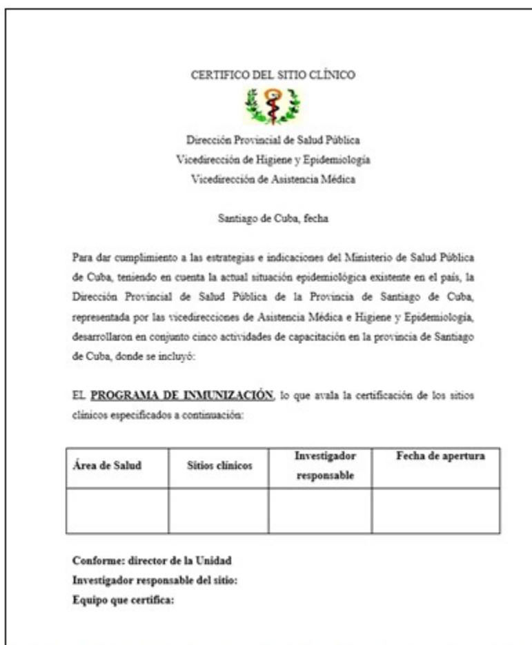
Fig. 2- Modelo de Certifico del Programa de Inmunización los sitios clínicos en Santiago de Cuba.