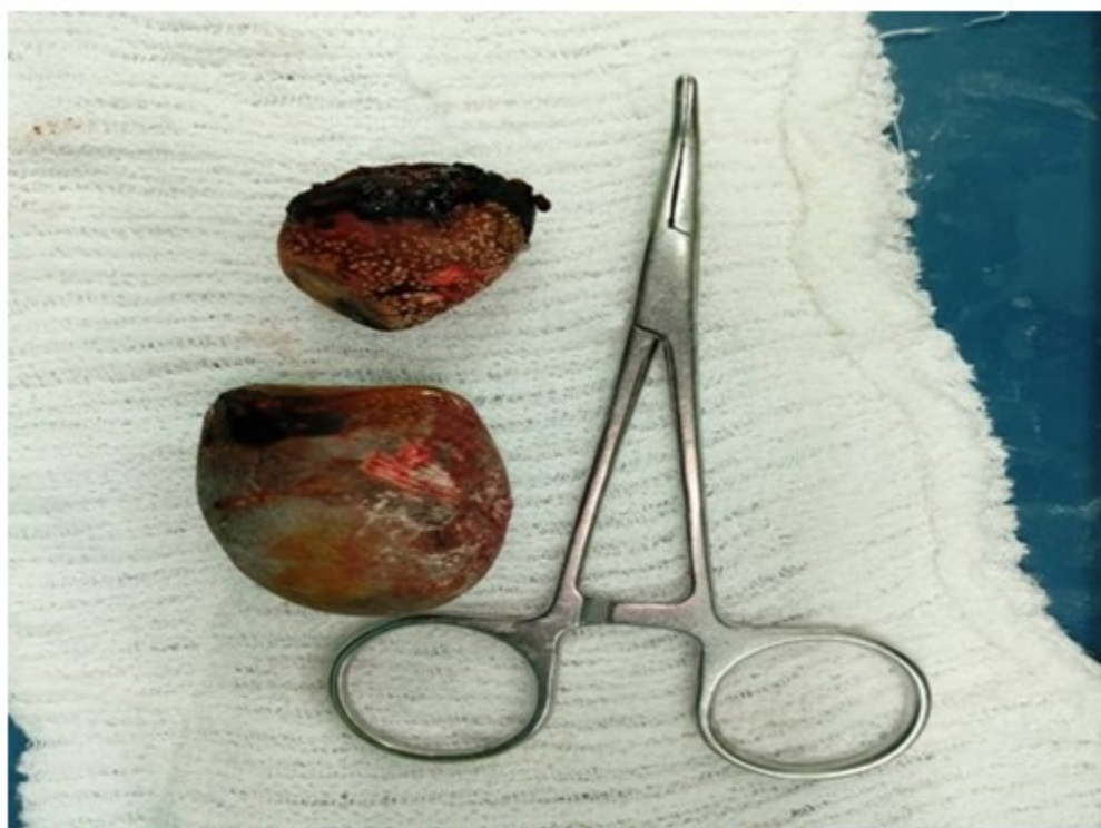
Fig. 4- Litos extraídos de la vía biliar principal.