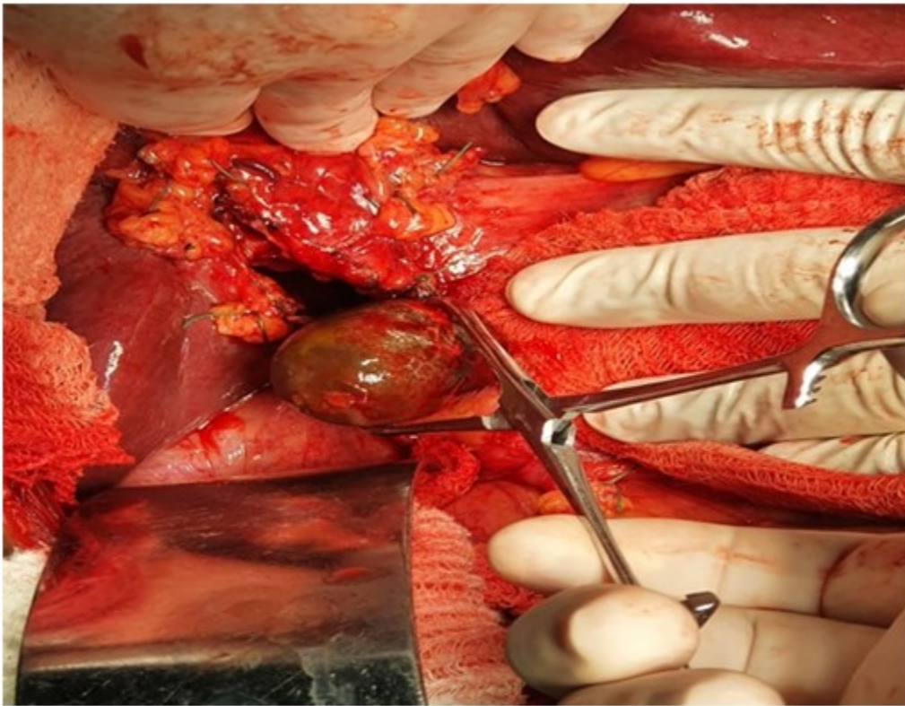
Fig. 3- Extracción de litos de la vía biliar principal.