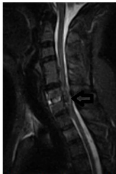
Fig. 2- La flecha señala los restos discuales intradurales.

Al despertar, la paciente presentó monoparesia crural derecha 1/5 y signo de Babinski derecho, por lo cual se solicitó de inmediato estudio de resonancia magnética nuclear (RMN), y se colocó metilprednisolona según esquema NASCIS III. La IRM se obtuvo 24 horas después, e informó la presencia de restos de disco y compresión medular. (Fig. 2).