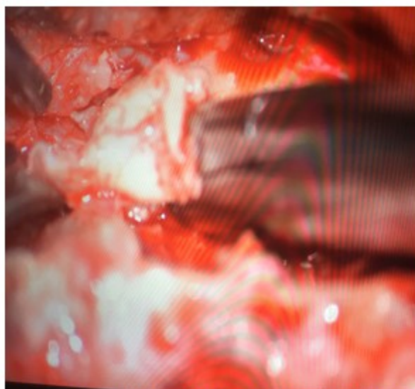
Fig. 3- Extracción del contenido intradural de la hernia.

Se sospechó contenido intradural de la hernia, por lo cual se realizó corporectomía C6, injerto y fijación con placa de titanio y tornillos. Se completó el proceder 48 horas después de la primera cirugía, obteniendo efectivamente restos discuales intradurales (Fig. 3), sin presenciar salida de líquido cerebroespinal a través del sitio por el cual perforó la hernia a la duramadre.