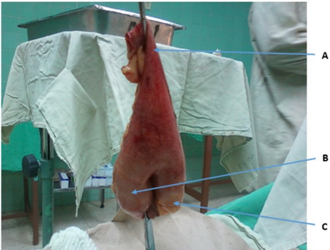
Fig. 1- Divertículo de Meckel con segmento de intestino delgado adyacente. A: extremo proximal de intestino delgado resecaado; B: divertículo de Meckel; C: extremo distal de intestino delgado resecaado.