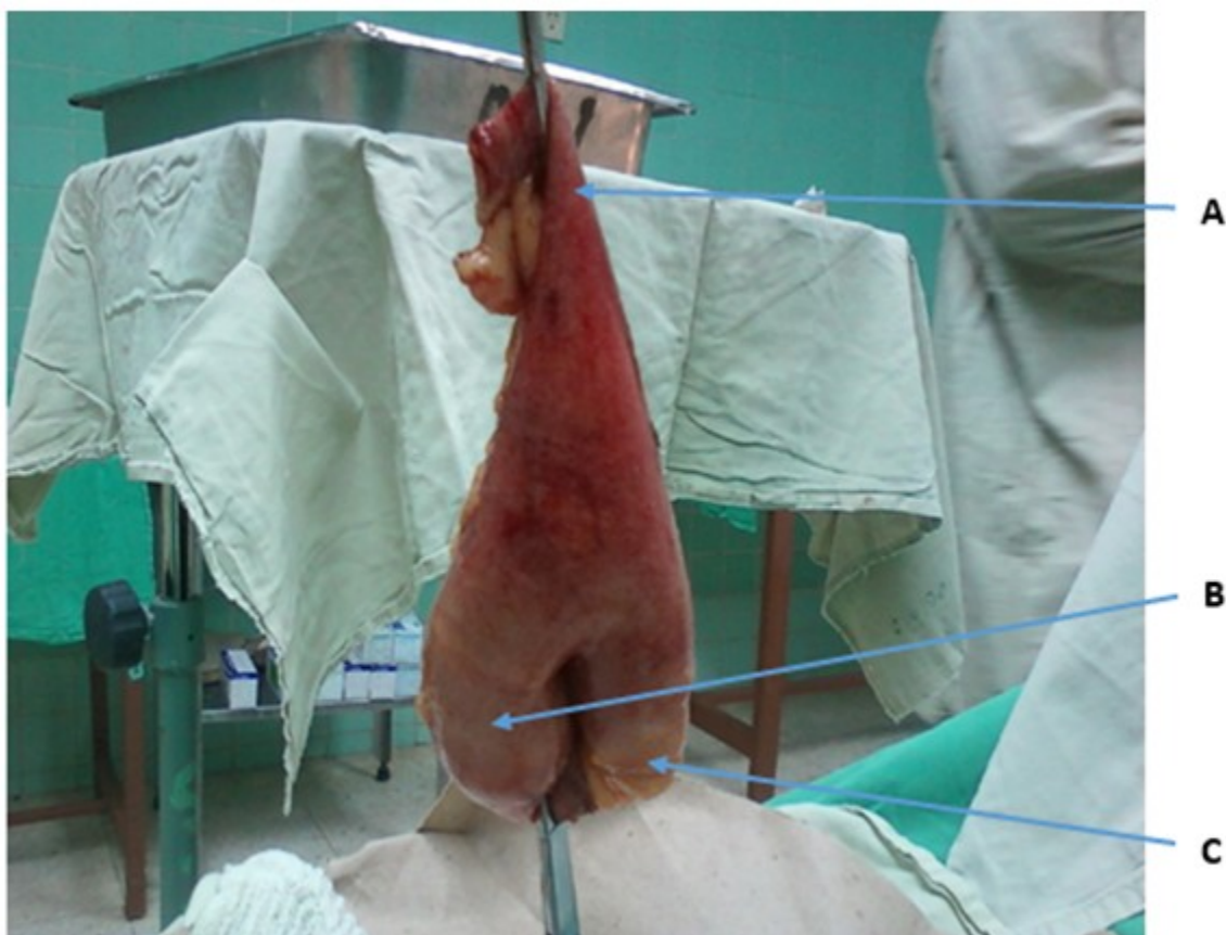
Fig. 1- Divertículo de Meckel con segmento de intestino delgado adyacente. A: extremo proximal de intestino delgado resecaado; B: divertículo de Meckel; C: extremo distal de intestino delgado resecaado.