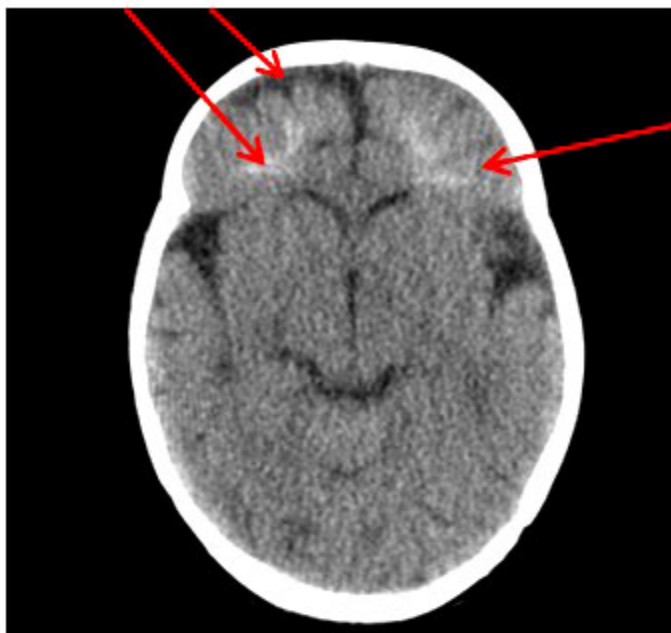
Fig. 2. Imagen tomográfica donde se observan múltiples imágenes hiperdensas lineales, aisladas y periventriculares en ambos hemisferios cerebrales.

El electroencefalograma del caso arrojó los siguientes resultados: patológico, asimetría