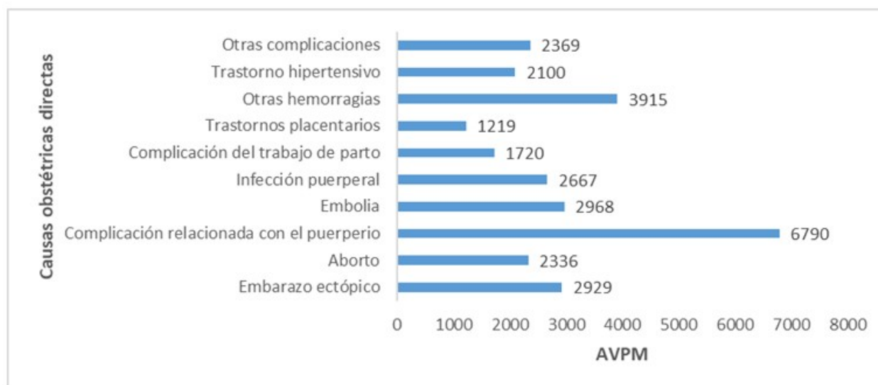
Fig. 4- Años de vida perdidos por mortalidad debido a causas obstétricas directas. Cuba 2005-2018.