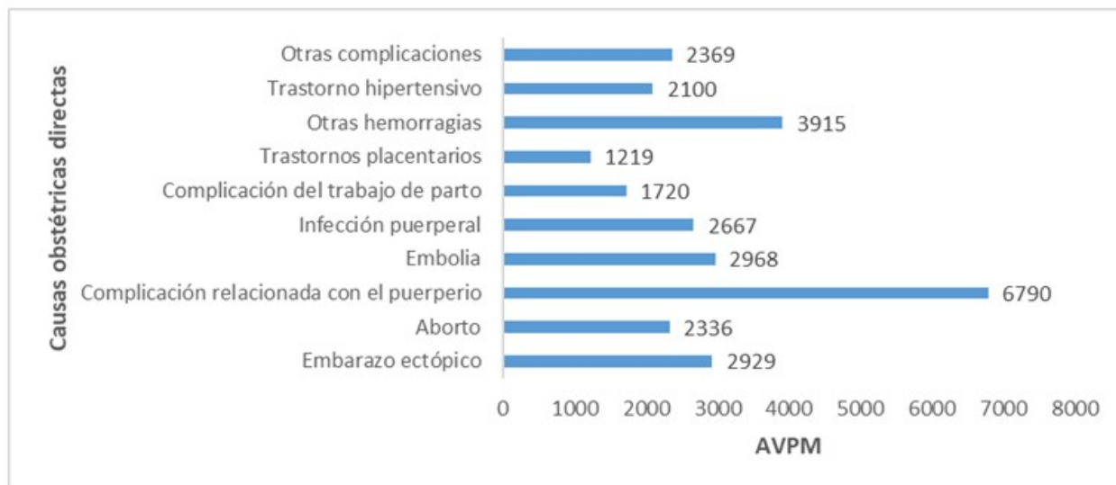
Fig. 4- Años de vida perdidos por mortalidad debido a causas obstétricas directas. Cuba 2005-2018.