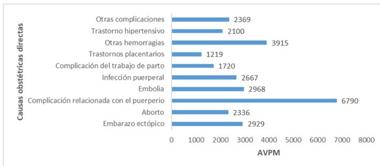
Fig. 4- Años de vida perdidos por mortalidad debido a causas obstétricas directas. Cuba 2005-2018.