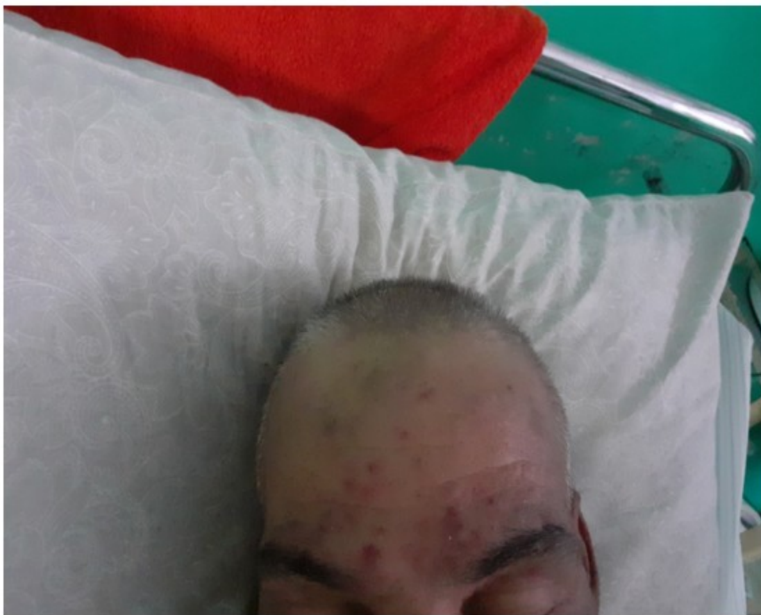
Fig. 1. Imagen que muestra el eritema en heliotropo y edema en párpados.

A la auscultación del aparato respiratorio, presencia de estertores crepitantes en base pulmonar derecha.