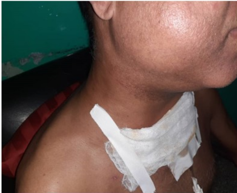
Fig. 2. Imagen que muestra el edema facial.

Posteriormente a las 48 horas de su egreso el paciente comienza con aumento de volumen de toda la cara el cuello y región supraclavicular. Se constata al examen físico presencia de enfisema celular subcutáneo. (Figura 2).