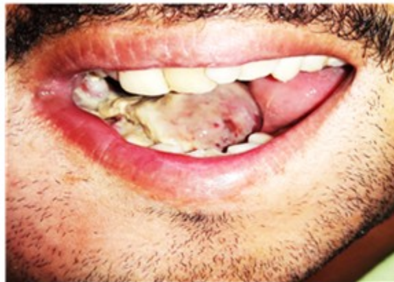
Fig. 2 Imagen donde se observa una masa blanquecina indurada, pediculada proveniente del suelo de boca que desplazaba la lengua hacia la izquierda.

Se procedió a realizar tomografía axial computarizada, (Figura 3), la cual reveló imagen hipodensa con captación heterogénea del medio